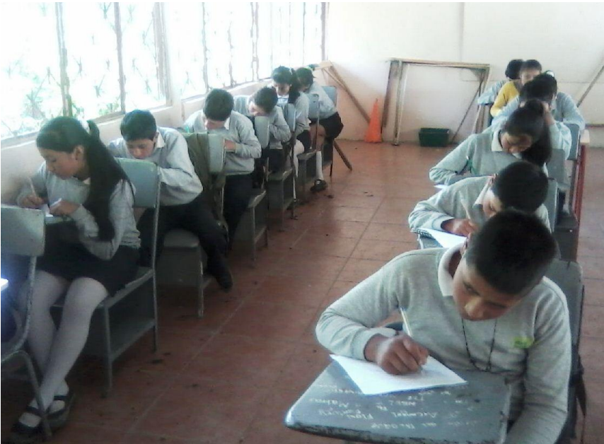
Figura 4. Alumnos contestando la encuesta