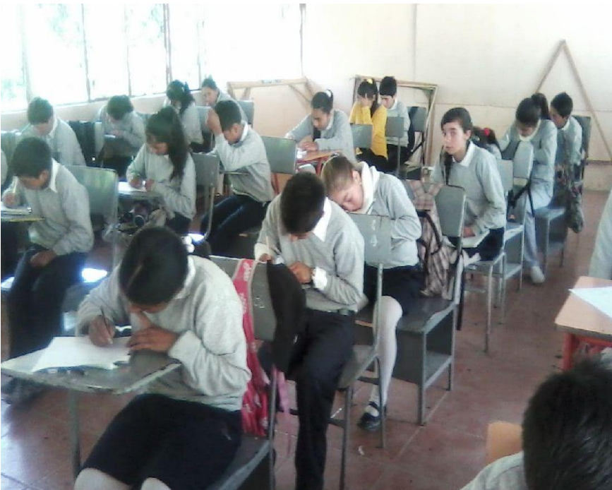
Figura 5. Alumnos contestando la encuesta