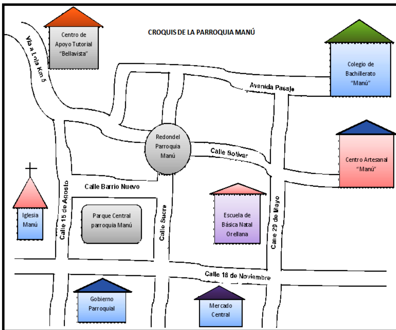
Figura 1. Croquis de los centros educativos investigados