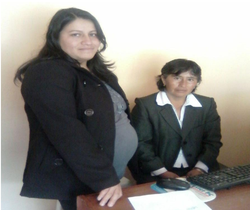
Figura 2. Alumna solicitando autorización