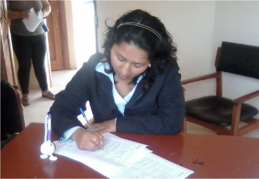
Figura 6. Docente contestando la encuesta