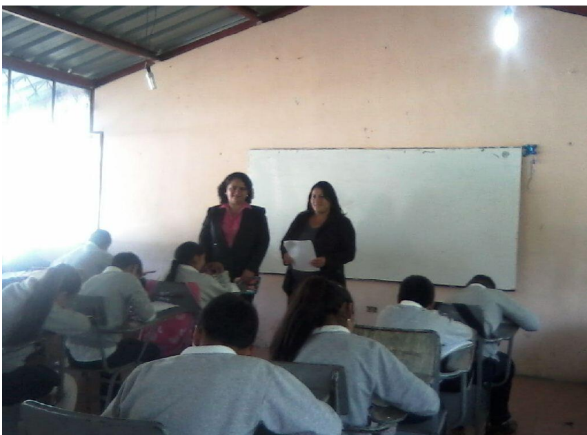
Figura 3. Fase previa a la encuesta