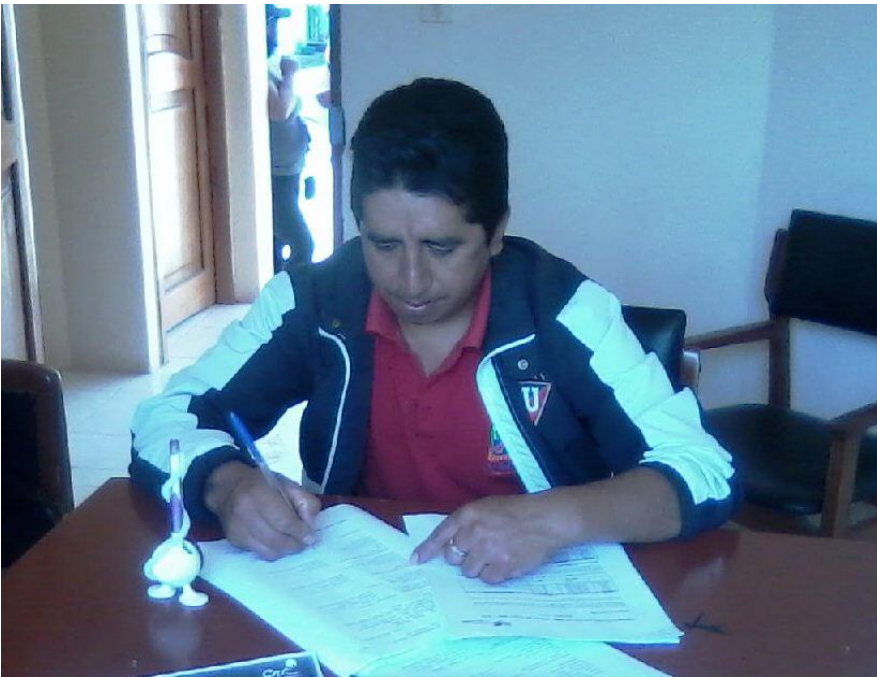
Figura 7. Docente contestando la encuesta