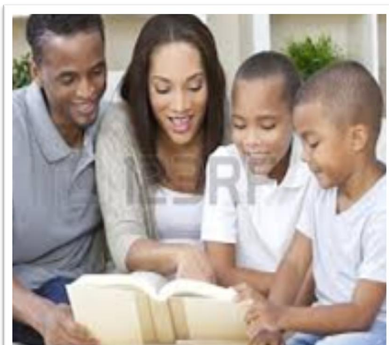
Figura 7

La participación familiar en los procesos educativos apoya el desarrollo de las competencias lectoras, la motivación y la autoestima de los estudiantes (Actis, 2008). Sin lugar a dudas, las actitudes que los padres tienen a cerca de la lectura contribuyen sobre la actitud que tendrá el niño durante sus años de escolaridad.