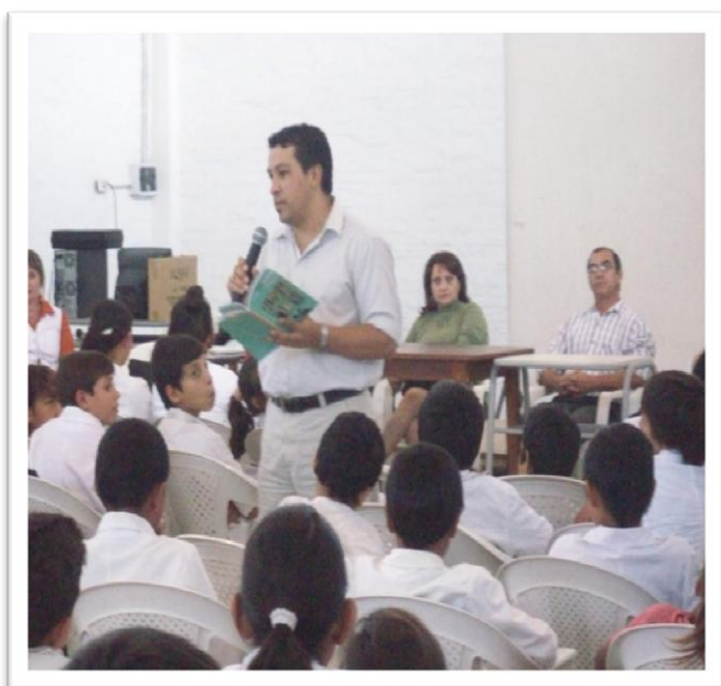
Figura 2 Fuente: Conferencista animando a grupo de jóvenes.

Sin lugar a dudas, a los jóvenes se los debe motivar para que acepten este desafío y se embarquen en la aventura de la lectura de textos literarios, no solo porque les llegue a proporcionar deleite y placer, sino porque además esta les proporciona las condiciones para desarrollar la inteligencia, y les permite formarse como personas más cultas, reflexivas, críticas, autónomas y libres, capaces y competentes en