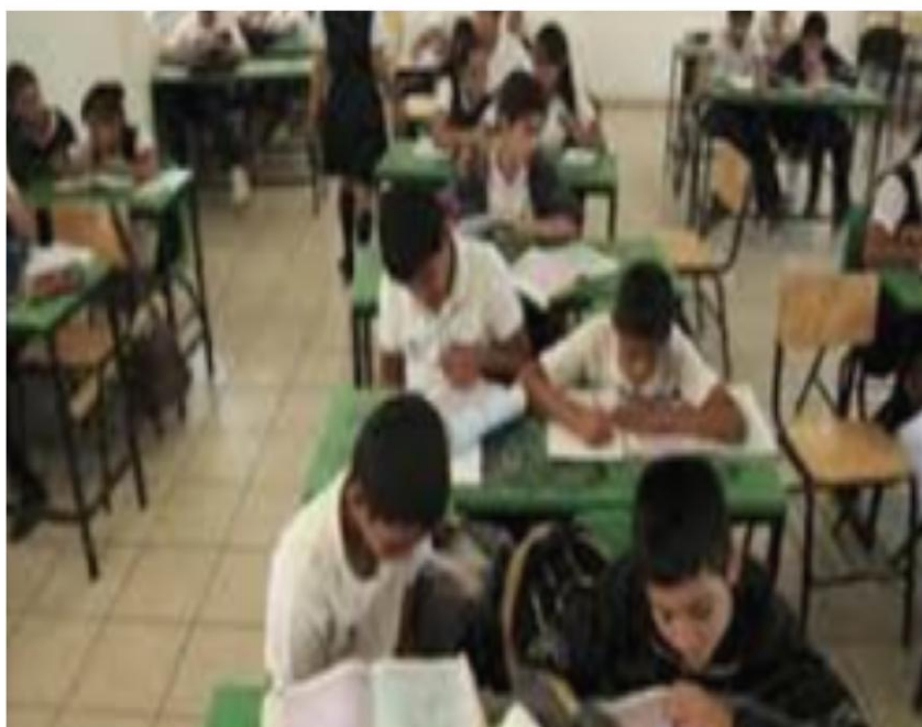
Figura 5 Fuente: Estudiantes motivados a la lectura.

aquellas que aportan información que no es fundamental en la historia como las descripciones de los personajes, del ambiente, de los acontecimientos, etc. (Acherando,2009)