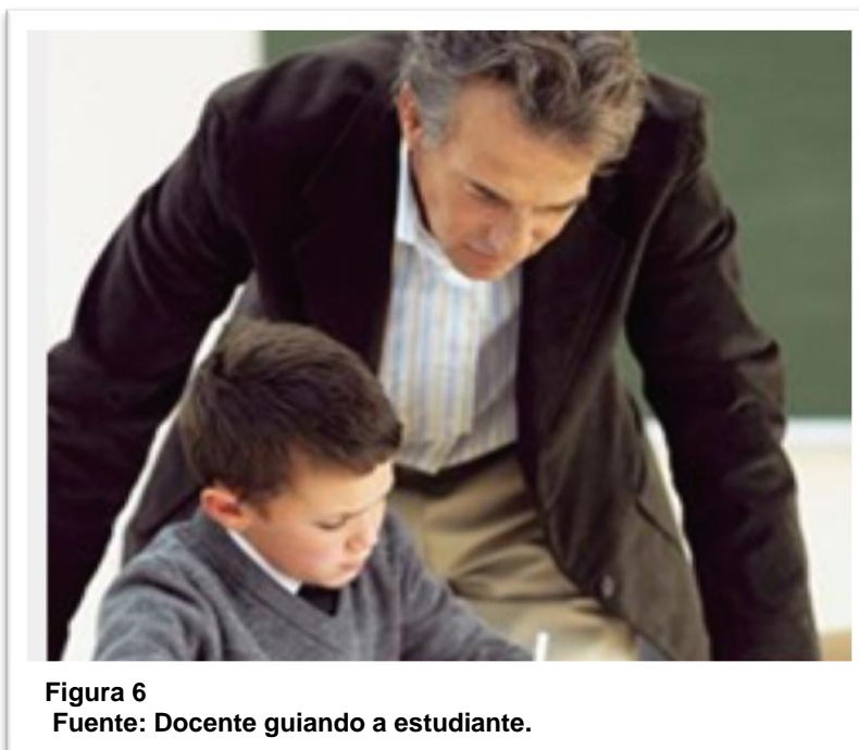
Figura 6 Fuente: Docente guiando a estudiante.

El papel del profesor de la institución educativa es decisivo para respaldar a los estudiantes y que logren aumentar su nivel de comprensión en la lectura. Los tipos de preguntas que haga el docente pueden influir en el nivel de comprensión que logran adquirir los estudiantes. Se suele hablar de tres niveles de preguntas: el nivel literal,