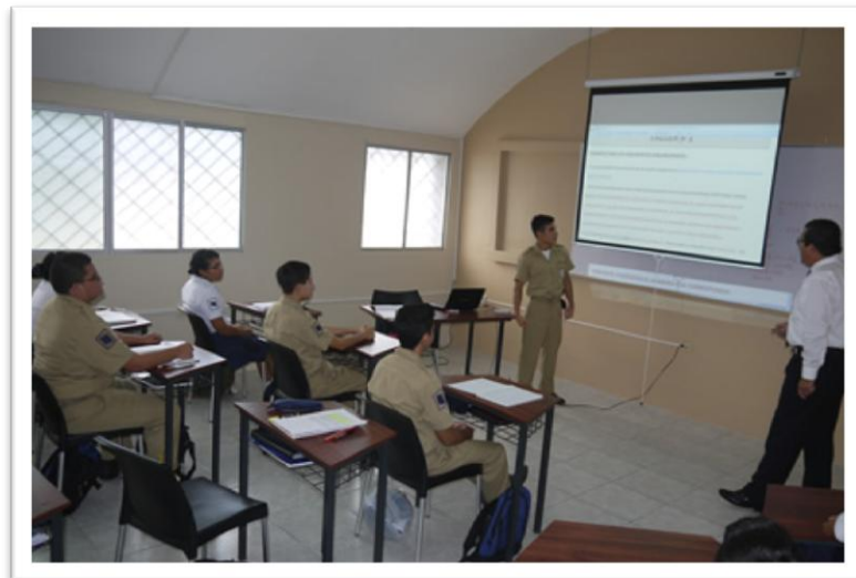
Aula de Clases