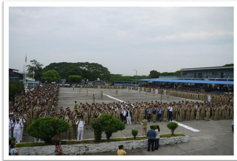
Patio central del Colegio