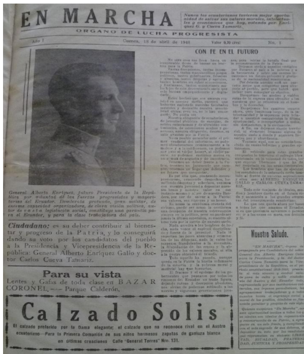
Imagen 9. En Marcha

Fuente: Hemeroteca Alfonso Andrade Chiriboga. Elaboración: propia.