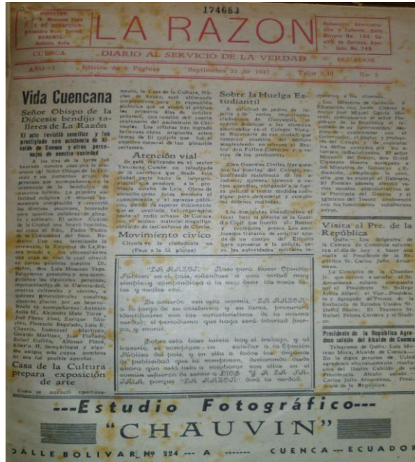
Imagen 7. La Razón