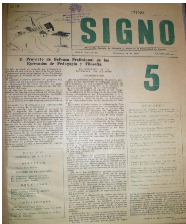
Imagen 19. Signo