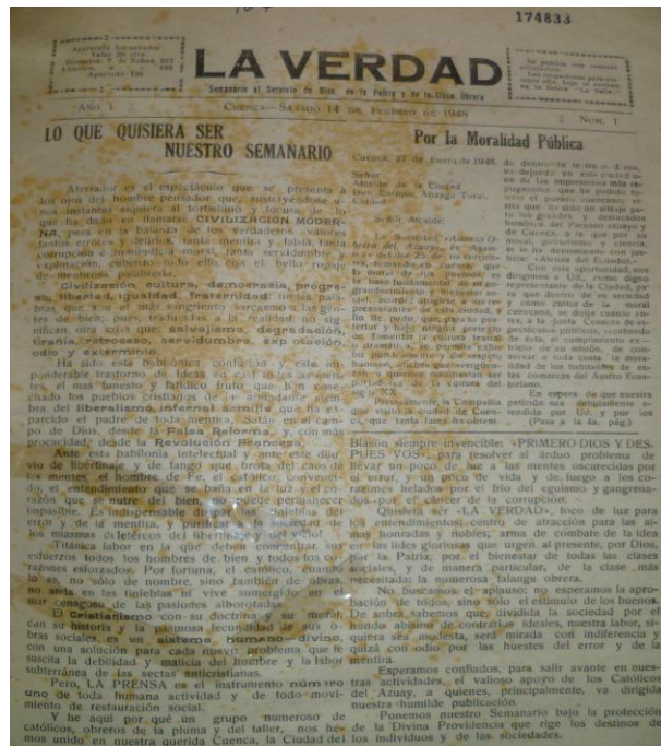
Imagen 8. La Verdad