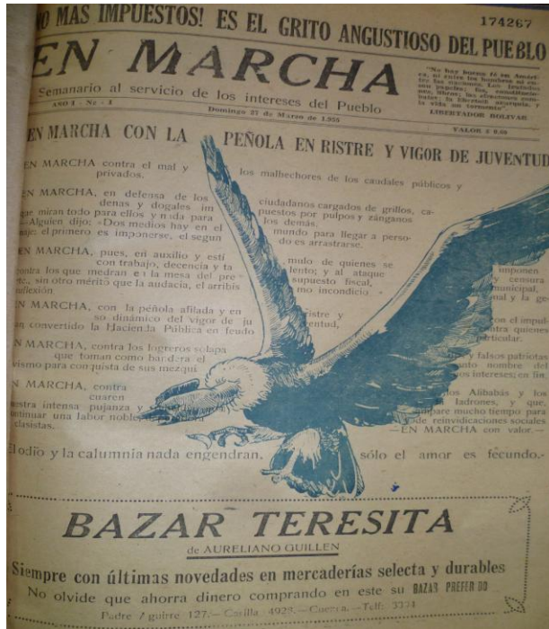
Imagen 17. En Marcha