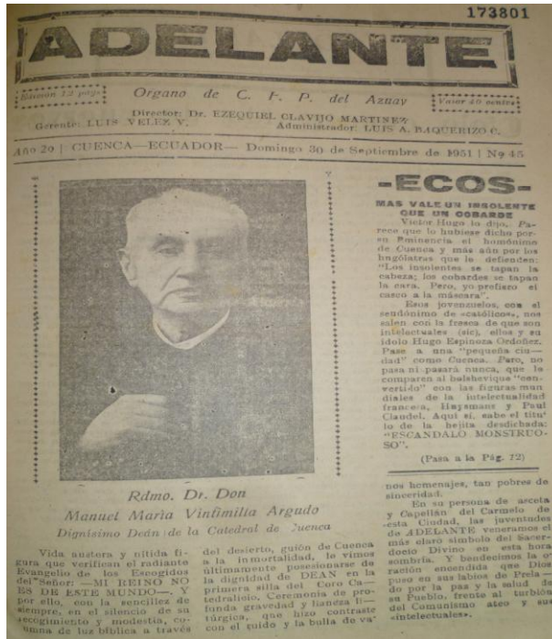
Imagen 13. Adelante