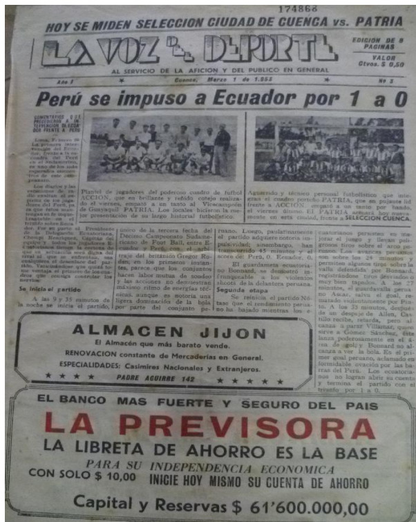
Imagen 15. La Voz del Deporte