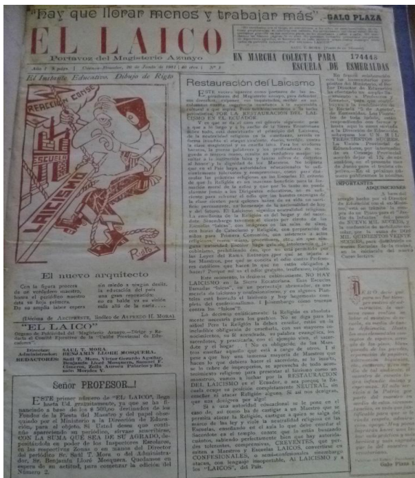
Imagen 10. La Escoba