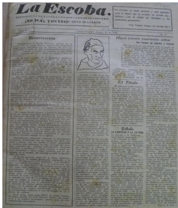
Imagen 10. La Escoba

Fuente: Hemeroteca Alfonso Andrade Chiriboga. Elaboración: propia.