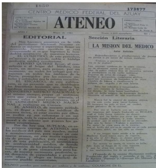
Imagen 20. Ateneo