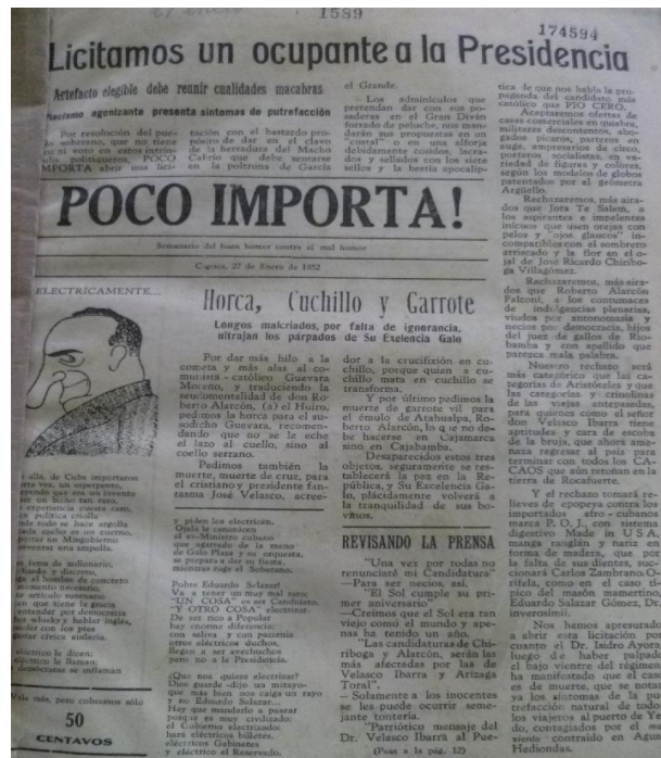
Imagen 14. Poco Importa.