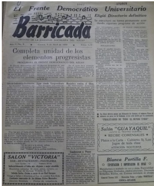
Imagen 18. Barricada