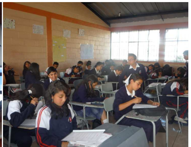
Estudiantes de noveno A y B unificados