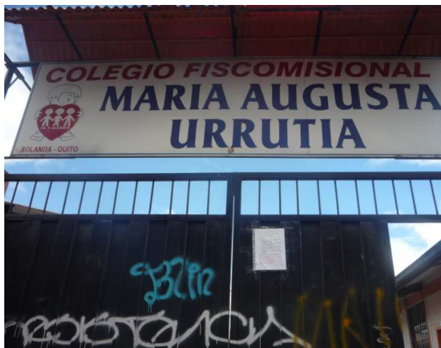
Entrada de la institución

Aplicación de encuestas a los estudiantes y docentes de noveno año de educación básica del colegio Fiscomisional “María Augusta Urrutia” de Fe y Alegría, al sur de Quito.