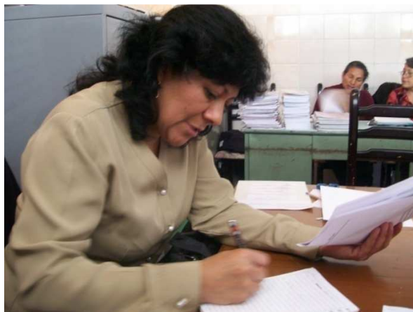
Docentes contestando el cuestionario