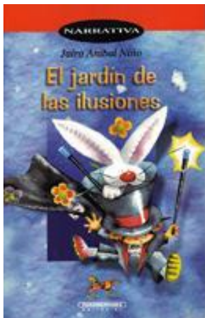
Ilustración 3 Portada del libro El jardín de las ilusiones

Con toda la fe de su corazón puesta en la piedra de la Luna que guarda en su bolsillo, y en la dulzura de la palabra hechicera aprendida del mago Joaquincini para investirse con los fantásticos poderes que tuviera el mismísimo Merlín. El Gran Mago Sebastianini, capaz de realizar hazañas nunca vistas, está a punto de comprender para siempre cuál es el más bello sortilegio y cuál es la mayor riqueza que puede deslumbrar a un "Encontrador de Tesoros" (tomado de la contratapa de la obra)