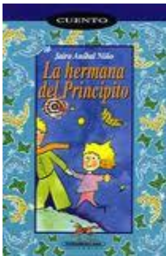
Ilustración 4: Portada del cuento La Hermana del Principito

Esta bella narración es un viaje en muchos sentidos. Jairo Aníbal Niño invita, en esta ocasión, a sus pequeños lectores al vuelo y aventura por los planetas de la poesía y la solidaridad, con un sentido profundamente americano.