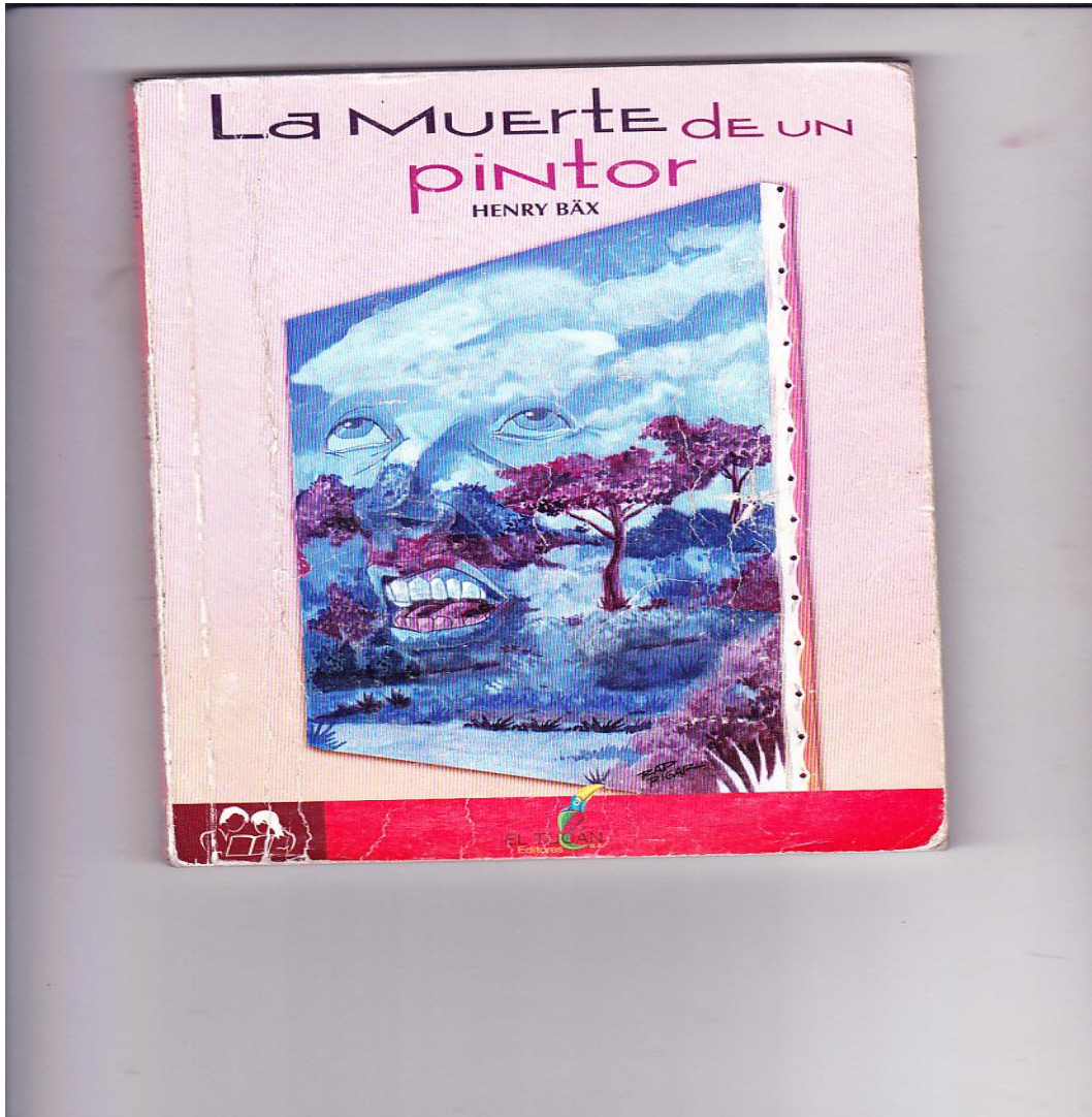
Portada del libro La Muerte de un Pintor