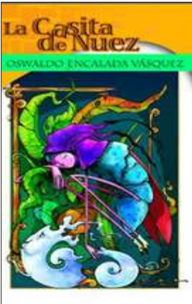
Carátula de libro La Casita de Nuez de Oswaldo Encalada Vásquez.

Destinatario: niños de 8 años en adelante.