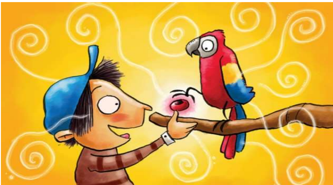
Carátula de libro El Milizho de Oswaldo Encalada Vásquez.

Destinatario: niños de 8 años en adelante.