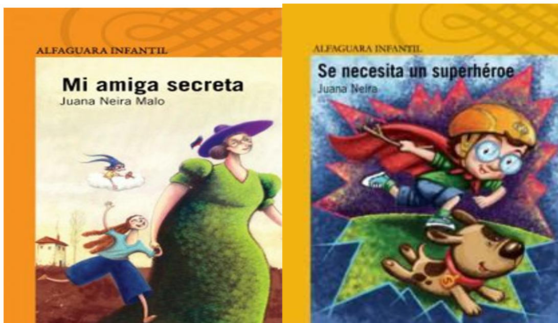
Figuras 2 y 3. Portadas de las obras analizadas.

http://www.prisaediciones.com/ec/libro/mi-amiga-secreta