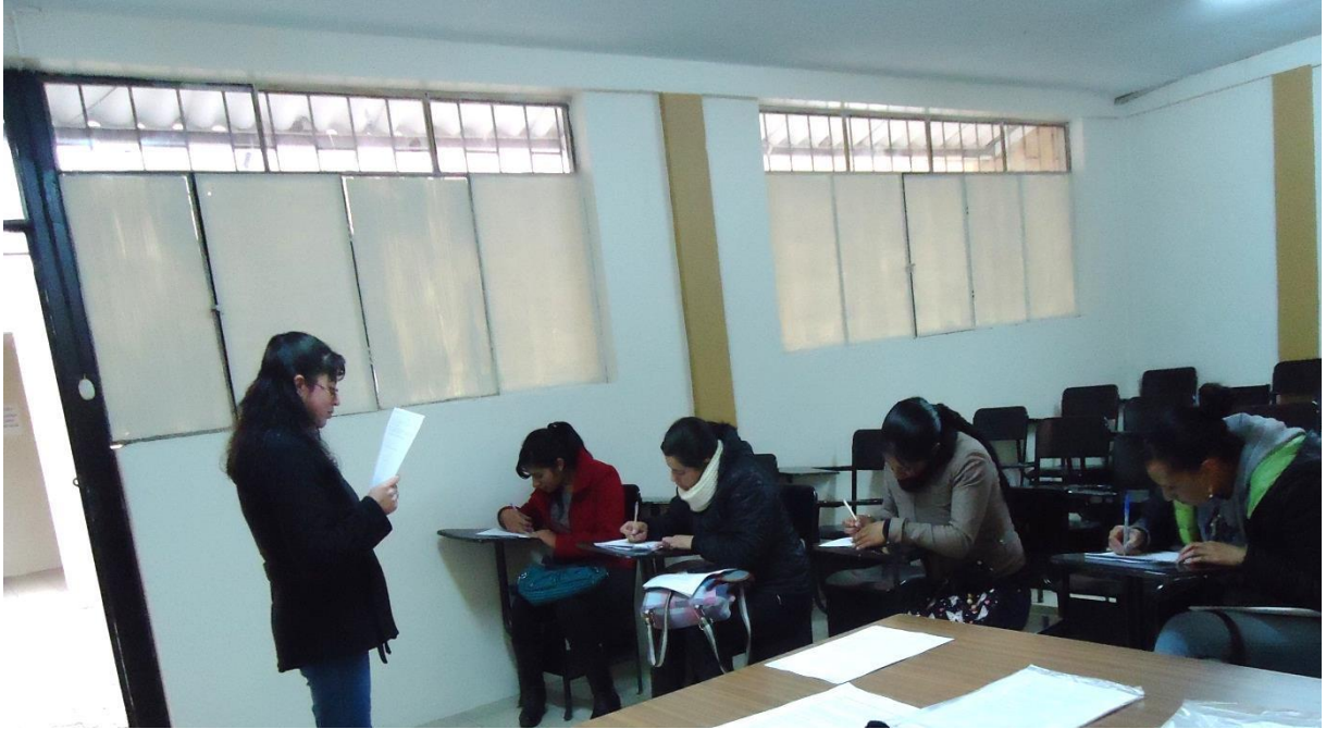
Fotografía 2. Diálogo con los mentorizados sobre sus dudas e inquietudes en el taller de mentoría.