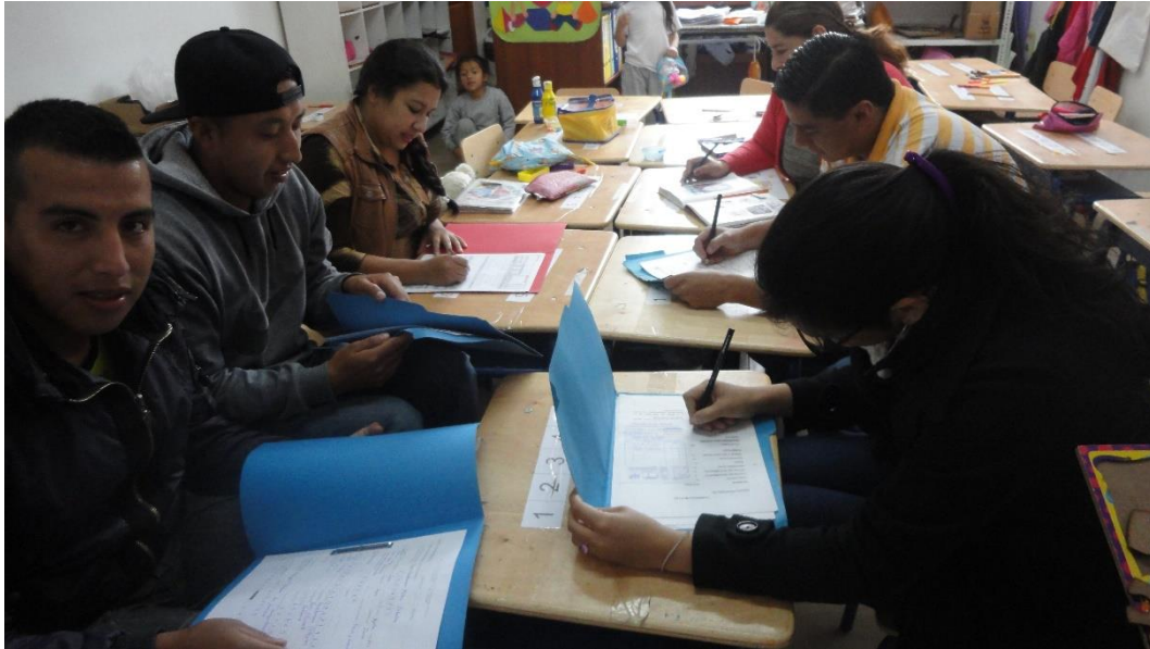
Foto 1. Aplicación de encuestas a los estudiantes de primer ciclo de Educación Superior a Distancia Centro Universitario de Loja.