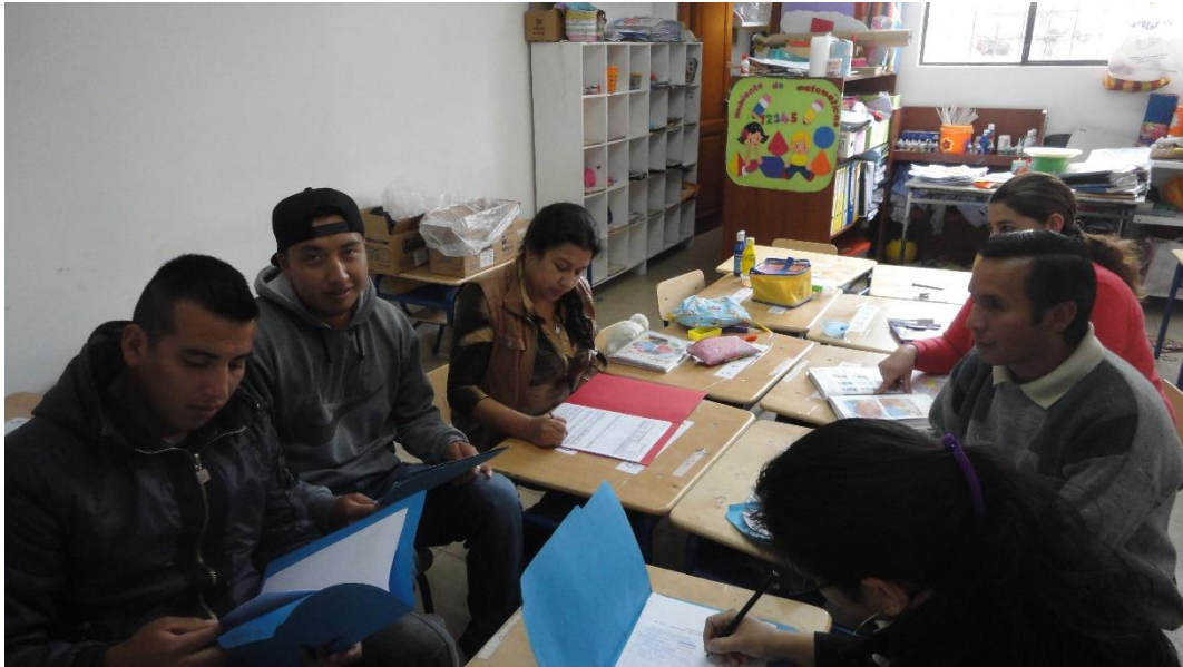
Foto 3. Desarrollo de preguntas de estudiantes mentorizados.