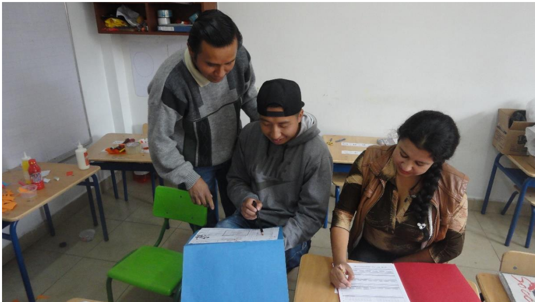
Foto 2. Indicaciones previas a inquietudes para seleccionar opciones por preguntas.