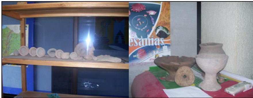
Piezas arqueológicas encontradas en la zona de Atacames que permanecen en la Oficina I-Tur