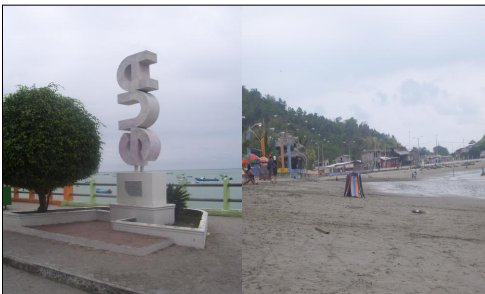
Malecón de Súa

Súa, es el primero de los balnearios de la provincia conocido por turistas en el país. La tranquilidad de sus aguas, el acogedor paisaje, su exuberante flora y fauna muy propia de las Galápagos, son algunas de sus características más sobresalientes. La playa es como una gran piscina que permite a los turistas bañarse, nadar y disfrutar de la tranquilidad del mar. Los restaurantes están situados en esta zona y cuentan con todas las delicias del mar.