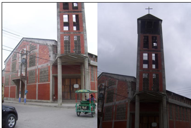
Iglesia Católica en Atacames

La mayor parte de la población es Católica, y en porcentajes mínimos, otras religiones.