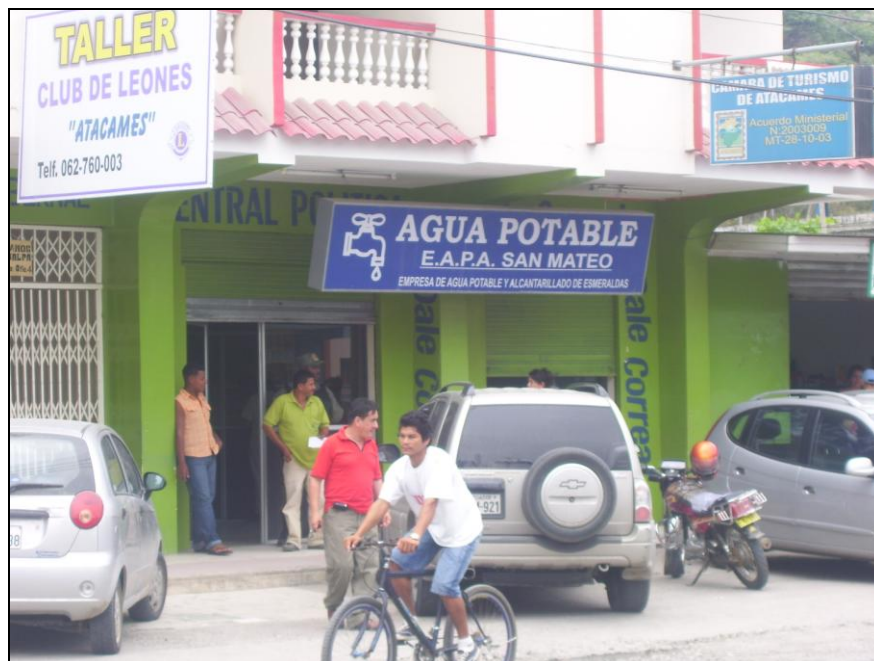
Empresa de Agua Potable y Alcantarillado de Esmeraldas - Atacames