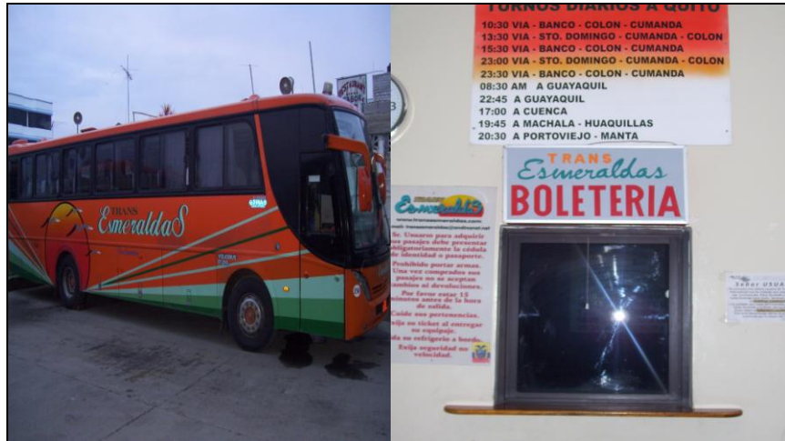
Cooperativa de Transporte Interprovincial Transesmeraldas

Las distancias terrestres desde Atacames hacia las principales ciudades del país son: