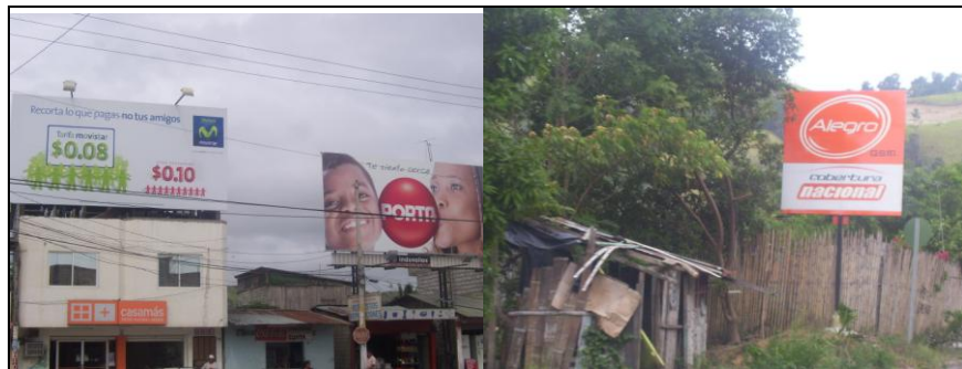
Publicidad de la Cobertura de Telefonías Celulares en Atacames