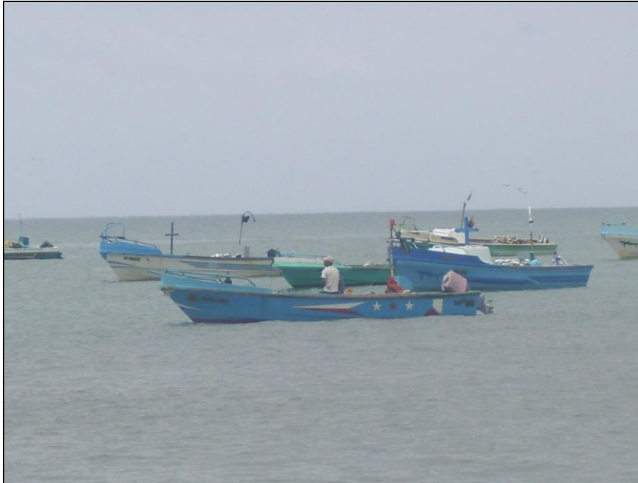
Pescadores de Súa

Súa, al tener dotación de infraestructura hotelera, es una de las fuentes productivas del sector, aunque a menor escala. En su mayoría, los propietarios de los hoteles son de Quito, Ambato y otras ciudades, sin embargo, llenan las vacantes con gente de la localidad.