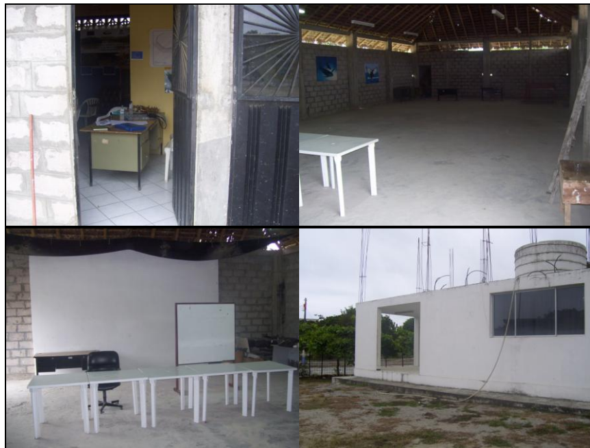
Instalaciones de la Asociación Aventuras del Mar - Súa

Aventuras del Mar promueve la investigación, educación y conservación para las futuras generaciones, a través de su centro de interpretación ambiental, en donde el visitante puede conocer un poco más sobre las especies marinas de este sitio.