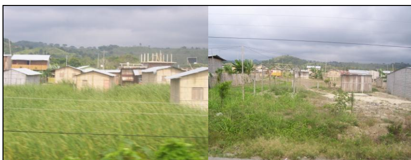
Viviendas de Caña en Atacames

Atacames presenta el 67,5% y Súa el 83.1% de pobreza por necesidades básicas insatisfechas, según un estudio publicado por Condem en su página web ( www.ccondem.org.ec -17/03/2008), por tanto, la infraestructura de vivienda es prácticamente pobre, pocas casas de hormigón y muchas de caña.