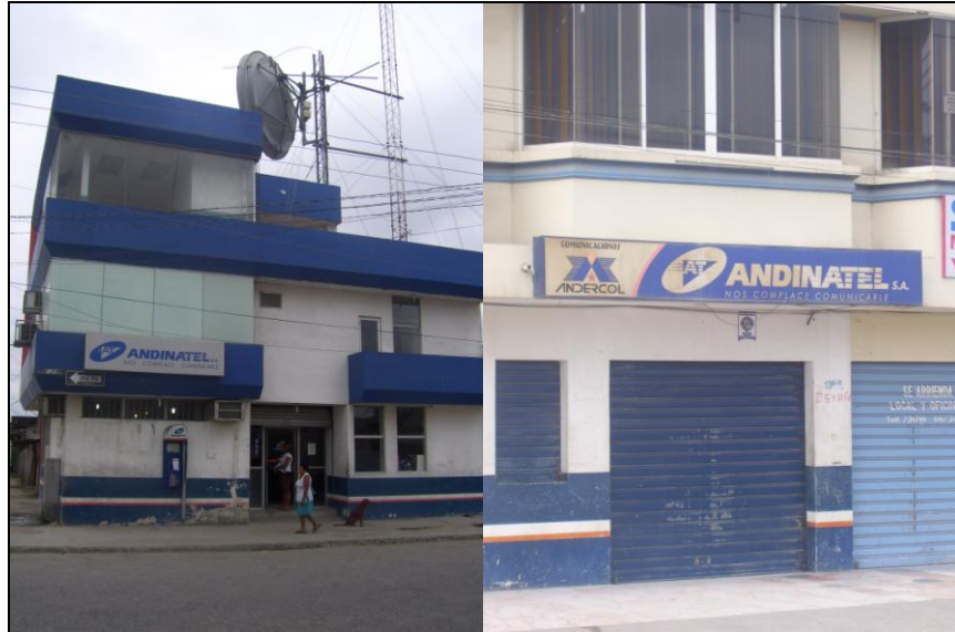
Oficinas de Andinatel – Atacames