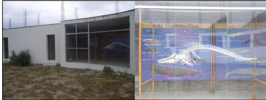
Centro de Interpretación Ambiental de la Asociación Aventuras del Mar - Súa