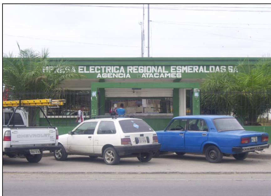
Agencia Atacames de la Empresa Eléctrica Regional Esmeraldas S.A.

El Servicio de energía eléctrica es ofertado por EMELESA (Empresa Eléctrica Esmeraldas S.A.) la cual llega a todo el Cantón con un servicio permanente, sin embargo, existen imprevistos ocasionales como es la caída de árboles que suspenden en servicio y en temporada alta, al existir demasiada gente vacacionando, la sobrecarga produce los cortes de energía que inmediatamente son solucionados por la Empresa Eléctrica.