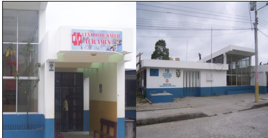
Centro de Salud No. 4 - Atacames

al paciente todas las especialidades así como cirugía, sin embargo no toda la población puede acceder a estas debido a los costos