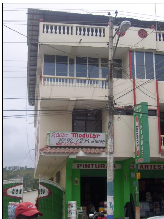
Oficinas de Radio Modular