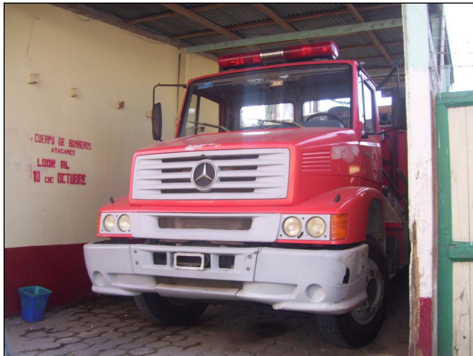
Estación de Bomberos de Atacames

Atacames cuenta además con oficinas de Cruz Roja, Capitanía del Puerto, Defensa Civil y Cuerpo de Bomberos.