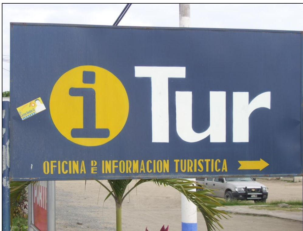
Oficina I-Tur del Municipio de Atacames

La Oficina iTur funciona en la Planta Baja del Municipio de Atacames, ubicada en la vía Principal, sector Cocobamba y sirve como punto de información y atención al cliente y punto de difusión de la oferta empresarial y de recursos y atractivos, que servirá tanto a los turistas como a los intermediarios para planificar sus acciones. En temporada alta, la oficina cuenta con la colaboración de estudiantes de varias universidades ubicados con carpas en las diferentes playas para ofrecer al turista información oportuna e inmediata.