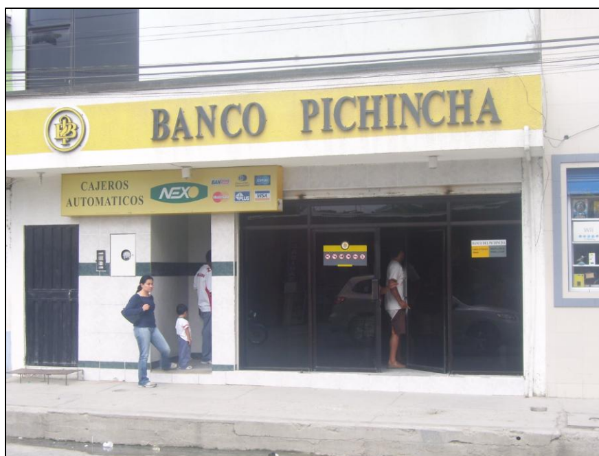
Agencia del Banco Pichincha en Atacames