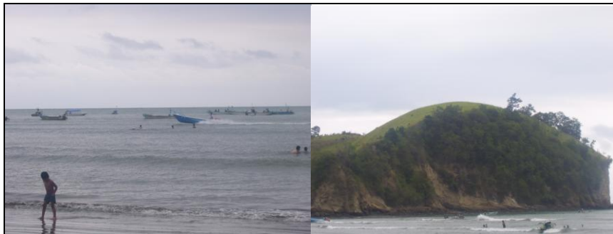
Playa de Súa

La Playa de Súa tiene aproximadamente 5 kilómetros de extensión. Cuenta con un ancho de aproximadamente 400 metros de amplitud.