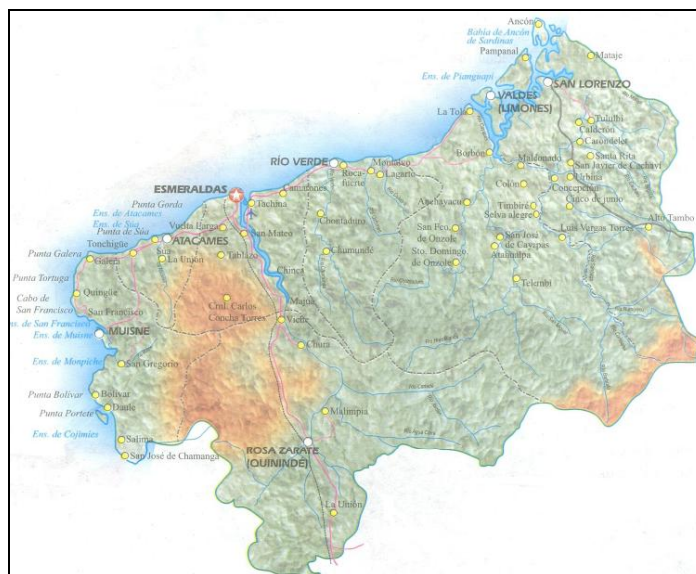
Mapa de la Provincia de Esmeraldas

Cantones: Esmeraldas, Eloy Alfaro, Muisne, Quinindé, San Lorenzo, Atacames, Río Verde, La Concordia.