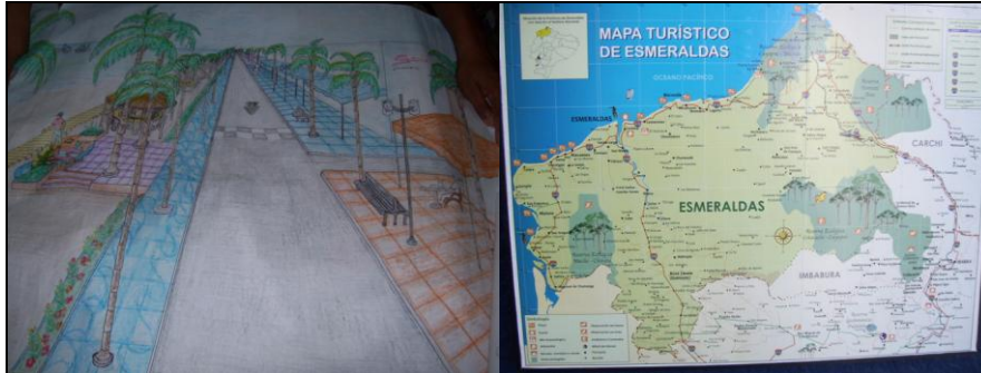
Material impreso de información turística de la Oficina I-Tur