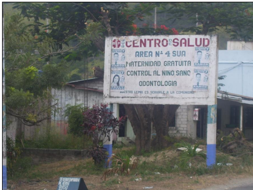
Subcentro de Salud de Súa