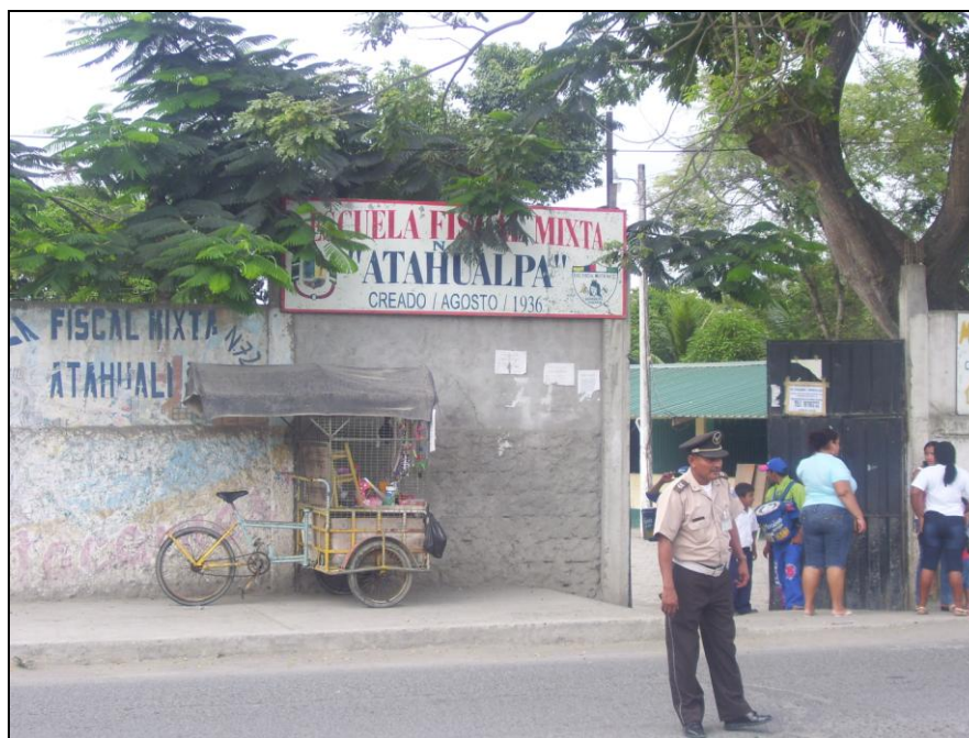
Escuela Fiscal Mixta "Atahualpa" - Atacames