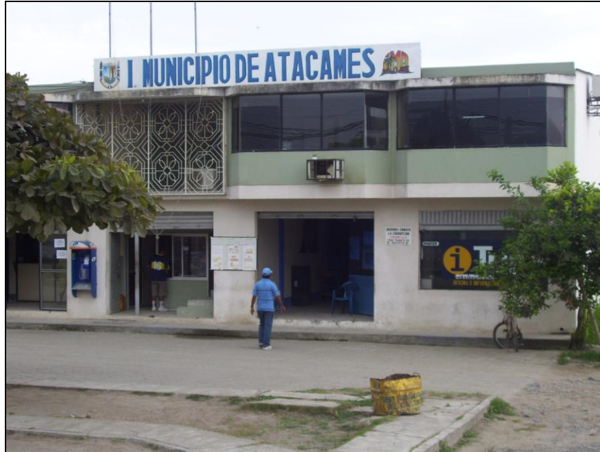
Municipio de Atacames, sector Copacabana