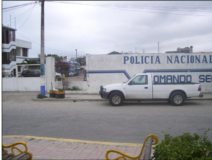
Destacamento de Policía, vía al Malecón de Atacames