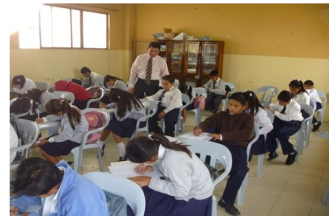
Encuestados: 7° A.E.B. Autor: Cesar Guerrero Vega