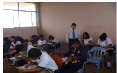
Encuestados: 3° Bachillerato Autor: Cesar Guerrero Vega