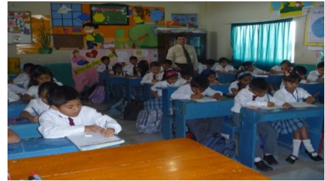
Encuestados: 5° A.E.B. Autor: Cesar Guerrero Vega