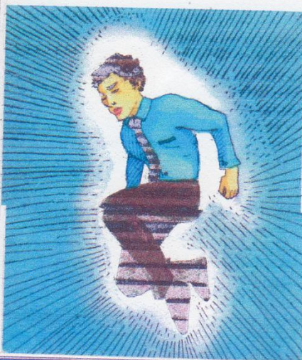
Ilustración: Santiago Padua

Este artículo exclusivo para GESTIÓN se publicó en colaboración con Franklin Covey Ecuador. MFConrad@franklincoveyecuador.com