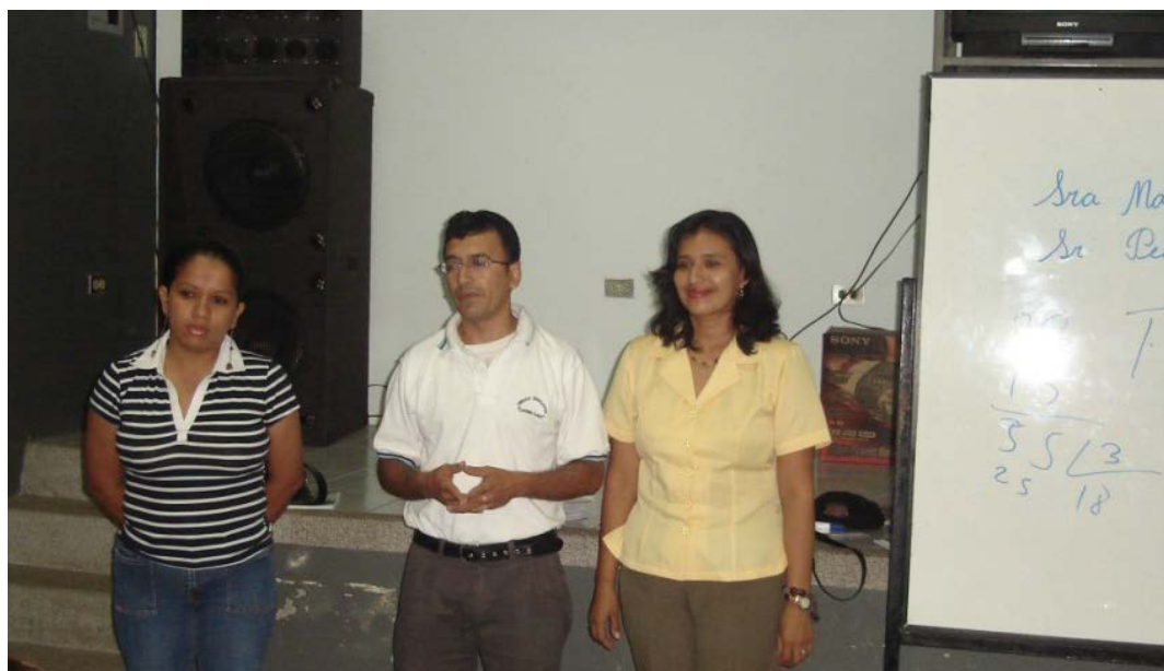
Explicando a los niños junto a una madre de familia y una maestra cual es el objetivo de la encuesta