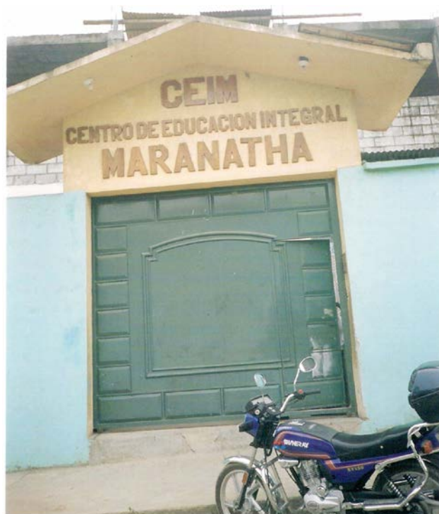
Fig.6: Entrada principal al Centro Educativo