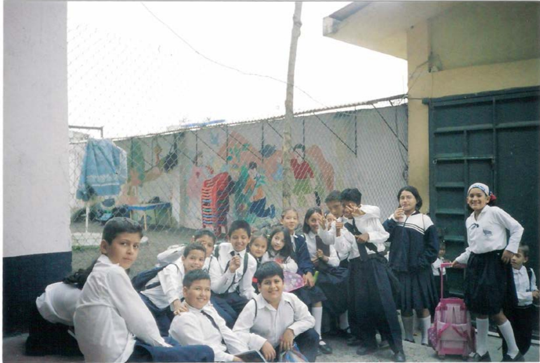
Fig.7: Algunos alumnos del sexto año permanecen en total compañerismo