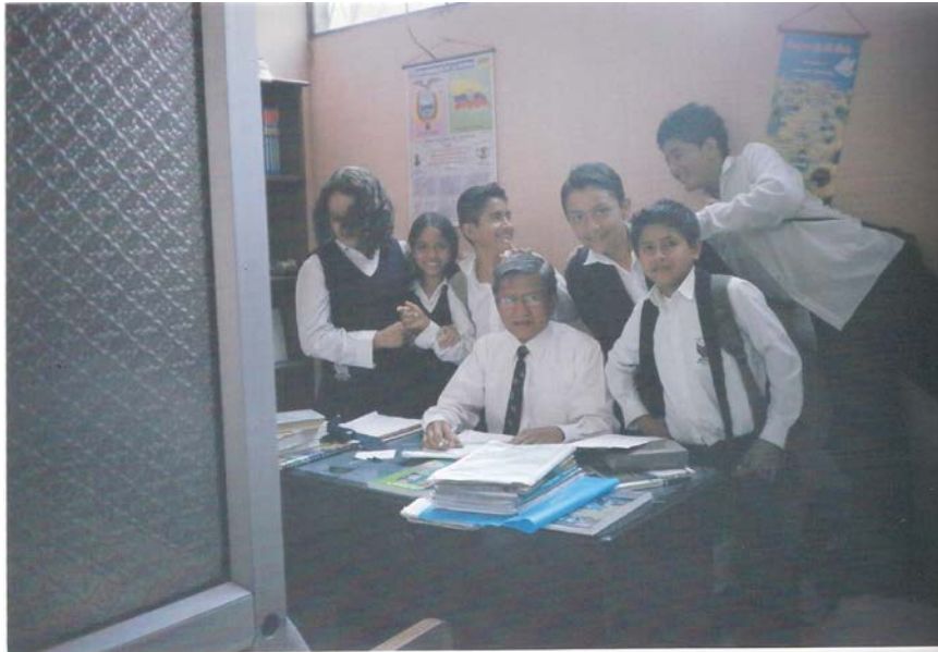
Fig.5: Aquí podemos notar la amistad y el compañerismo entre algunos alumnos y el Rector del Centro Educativo, el cual también es docente de Matemáticas