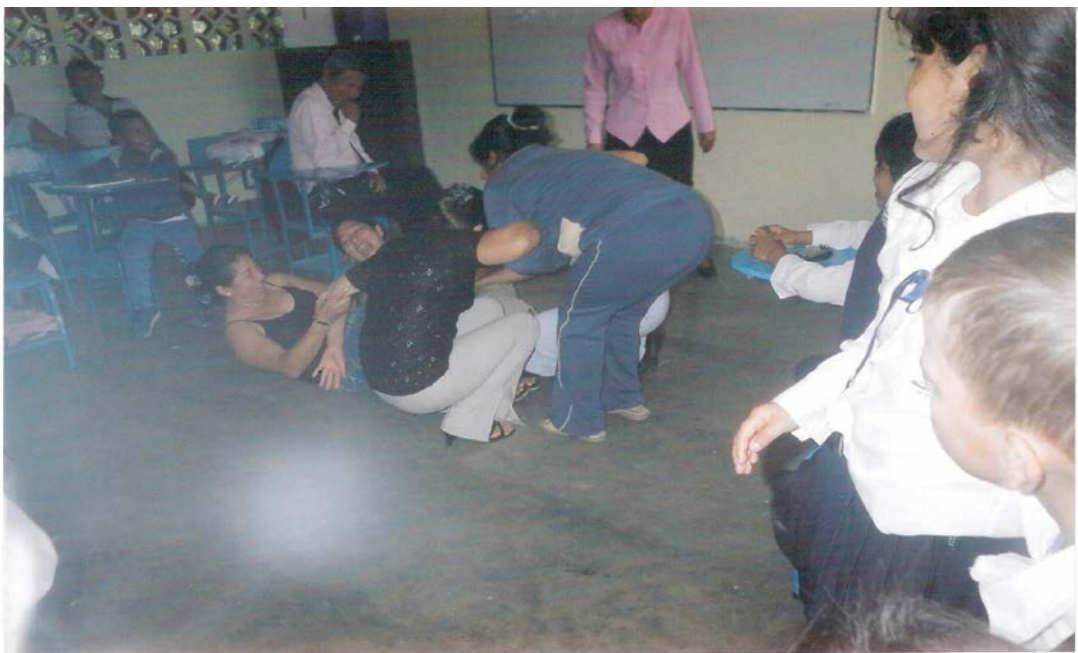
Fig.2: Aquí se realizó la dinámica titulada " La Piña"