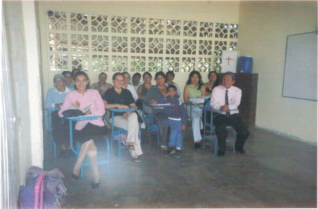
Fig.1: Aquí vemos a los Padres de Familia, el Director de la institución y la profesora del Tercer año, listos para comenzar la reunión en la cual se realizaron las encuestas