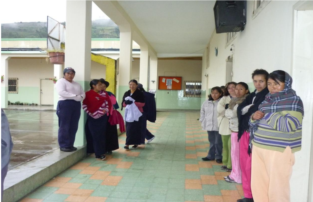
Imagen 3 Padres de Familia que colaboran con entusiasmo