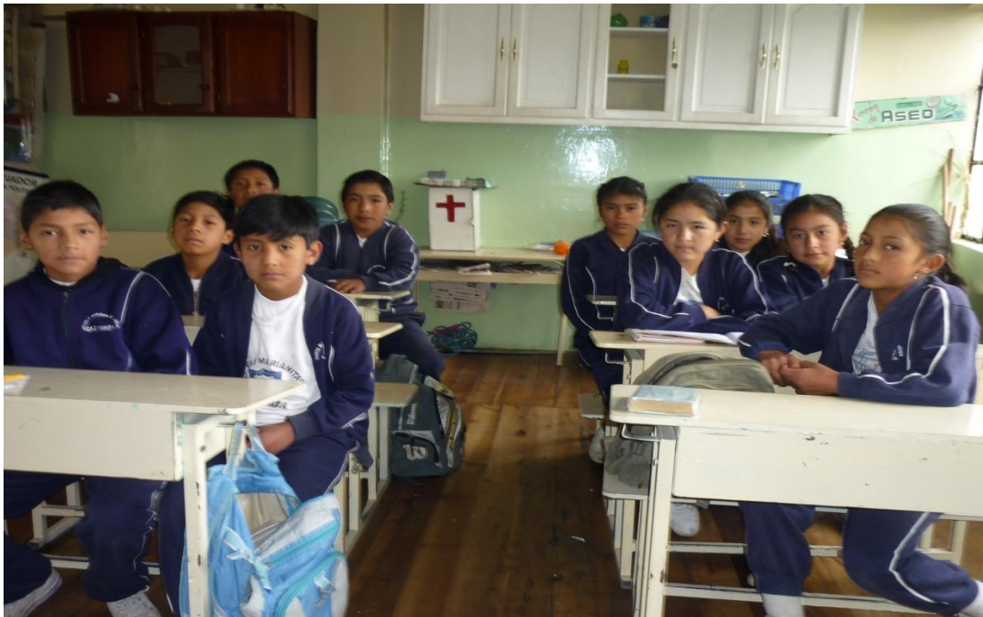
Imagen 4 Estudiantes de sexto y séptimo Año de Educación Básica