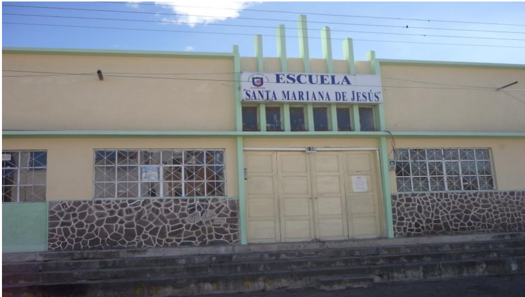
Imagen N° 1 Actual fachada de la Escuela Investigada