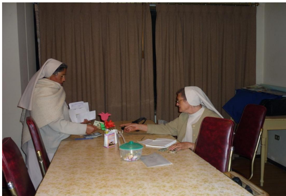
Imagen 2 Directivos actuales del Plantel