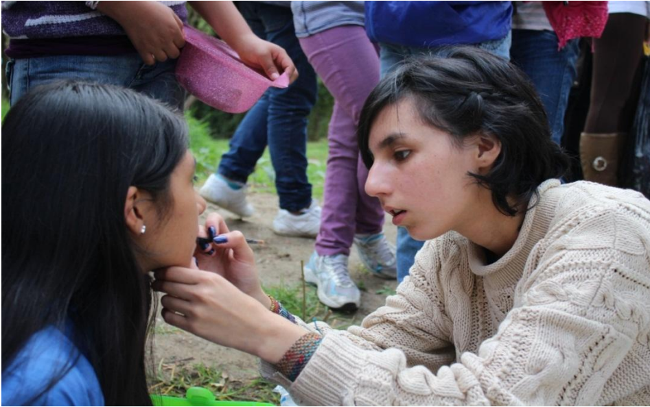
Anexo 1. Fotos de puesta en escena de la obra: “ El ladrón de la niñez ”.