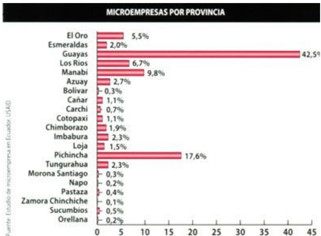
Gráfico N° 1: Microempresas por provincias en Ecuador