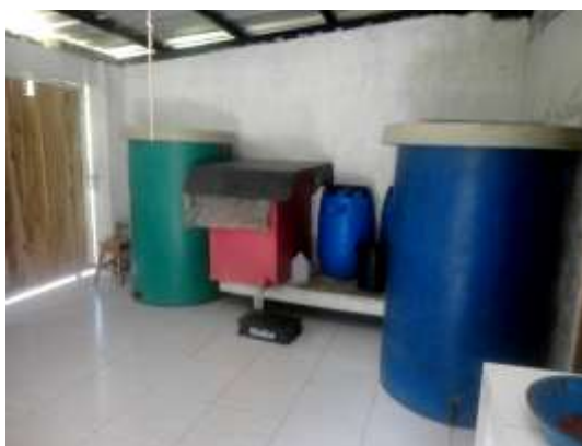
ILUSTRACIÓN N°9: Área de Maceración, del Centro Recreacional 7 Pingas. FUENTE Y AUTOR: Tesista/ Sayda M. Unkuch S.