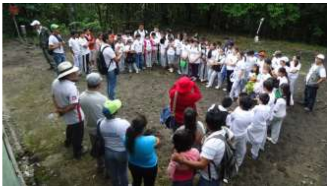
ILUSTRACIÓN N°16: Evento Día del Medio Ambiente con los niños de las Escuelas de Timbara, en el patio de las oficinas del PNP. FUENTE Y AUTOR: Tesista/ Sayda M. Unkuch S.