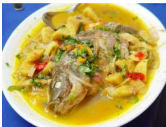
ILUSTRACIÓN N°32: Tilapia

FUENTE Y AUTOR: Junta Parroquial Timbara.