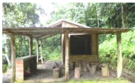
ILUSTRACIÓN N°22 Plaza Cívica Daniel Martínez.

Continuando con el recorrido, volvemos a subirnos a la buseta y continuar la ruta hacia Timbara, en el trayecto observamos desde la buseta plantaciones de caña hasta llegar a estos 3 atractivos que se ubican cerca una de la otra. Hostería Fogón Verde (Artesanías de Guadúa), La casita de Bambú (Artesanías de Guadúa), Playas de la Molienda Del “Tío Juan”. Este recorrido lo realizaremos por el itinerario de 40Hminutos. Cada uno de estos atractivos lo detallamos a continuación.