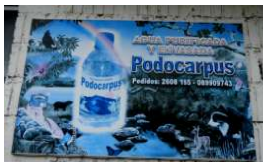
ILUSTRACIÓN N°20: Letrero y Números telefónicos para pedidos. FUENTE Y AUTOR: Tesista/ Sayda M. Unkuch S.

Seguimos el recorrido hacia la Parroquia Timbara y esta ocasión visitamos la Cascada El Aventurero, ubicada en el barrio Buenaventura. Llegamos hasta el estacionamiento que se encuentra junto a la cascada. Presenta dos caídas de agua de la misma fuente, separadas por una distancia de 70 metros, la primera es una caída libre de 30 metros y la segunda es de 10 metros siguiendo el perfil del lecho rocoso de aproximadamente 45°, con un caudal de 1.5 m 3 /s. La calidad física del agua varía en función del tiempo atmosférico. Aquí los