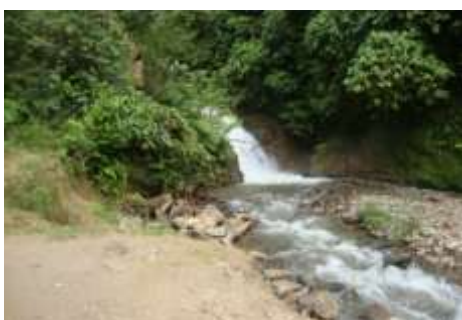
ILUSTRACIÓN N°21: Plaza Cívica Daniel Martínez. FUENTE Y AUTOR: Tesista/ Sayda M. Unkuch S.

En este lugar se puede realizar actividades gastronómicas, culturales y eventos para familias como para instituciones; facilitando la amplitud y la tranquilidad del sector.