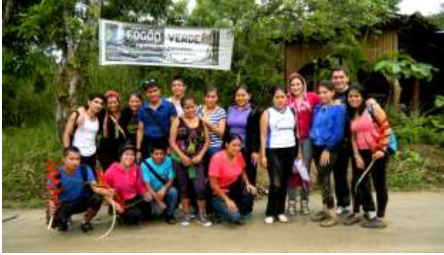
ILUSTRACIÓN N°23: Instalaciones del Fogón Verde.