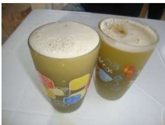
ILUSTRACIÓN N°31: Jugo de Caña.

FUENTE Y AUTOR: Junta Parroquial Timbara.