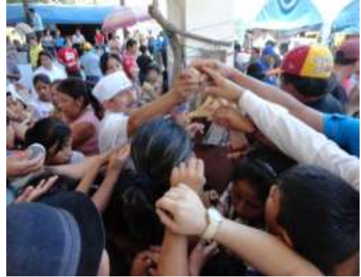
ILUSTRACIÓN N°28: Compartiendo con el público la mejor melcocha ganadora. Fiestas de Timbara 2013.

FUENTE Y AUTOR: Tesista/ Sayda M. Unkuch S.