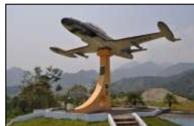
ILUSTRACIÓN N°10: Plaza Cívica Daniel Martínez. FUENTE Y AUTOR: Tesista/ Sayda M. Unkuch S.

Plaza Cívica Daniel Martínez: Se encuentra ubicada en el cantón Zamora, en el barrio La Chacra. Con una latitud de 9552098 y una longitud de 730376, a una altura de 980 msnm, cuya temperatura varía entre los 20° a 22°C y una precipitación pluviométrica que varía entre 1.5 a 1.75 cm3. La plaza Cívica está conformada por las armas y aviones que se usaron en esa ocasión. Dos ametralladoras AM-55. La Plaza Cívica Daniel Martínez sin lugar a duda es la síntesis perfecta y la mayor representación de la tenacidad y valentía del soldado ecuatoriano que por siempre ha defendido y seguirá defendiendo nuestra soberanía territorial.