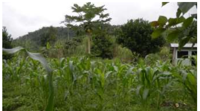
ILUSTRACIÓN N°26: Cultivos con abono orgánico. FUENTE Y AUTOR: Tesista/ Sayda M. Unkuch S.