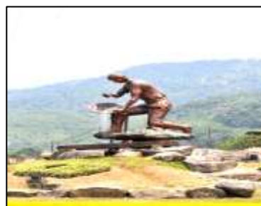
ILUSTRACIÓN N°11: Monumento El Minero. FUENTE Y AUTOR: Tesista/ Sayda M. Unkuch S.

Monumento El Minero: Se encuentra ubicada en el cantón Zamora, en la ciudad de Zamora, en el kilómetro 2; sobre la vía que conduce a la ciudad de Yantzaza. Con una latitud de 9551461 y una longitud de 729242, a una altura de 958 msnm, cuya temperatura ambiental varía entre los 20° a 22°C y una precipitación pluviométrica que varía entre 1.5 a 1.75 cm3. Es una escultura que emerge de una conformación rocosa, dicha figura sostiene en su mano izquierda un platón para lavar oro, y con su mano derecha sujeta la pala que descansa sobre su hombro. La composición es muy sencilla pero muy demostrativa puesto que rescata el valor del trabajo simple pero arduo del minero en el que utiliza una herramienta ancestral para el lavado de oro: “el platón”, además la pala sobre el hombro da la sensación de descanso luego de la jornada, equilibra y da ritmo a la composición.