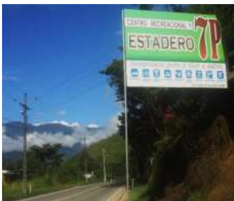
ILUSTRACIÓN N°3: Letrero, en la Avenida Principal, del Centro Recreacional 7 Pingas.

1.- A veinte minutos del terminal terrestre de la ciudad de Zamora se encuentra la Parroquia Timbara, donde se sitúa El Centro Recreacional 7 Pingas. Su funcionamiento es durante todo el año y aquí empezaremos el circuito recorriendo sus instalaciones.