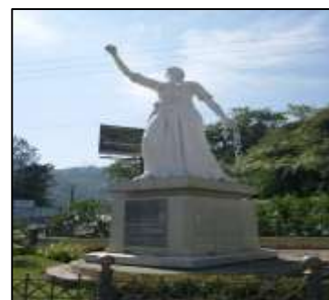
ILUSTRACIÓN N°13: Monumento a Naya o la Chapetona.