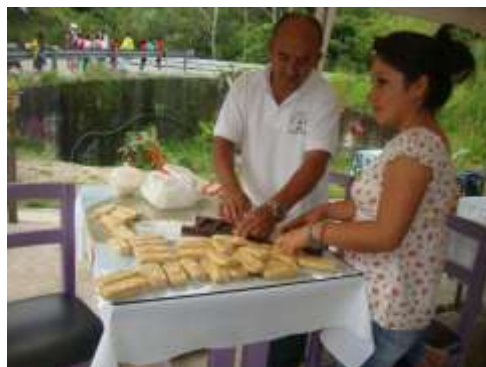
ILUSTRACIÓN N°30: En las Carpas de la Asc. La Timbarita. Elaboración de la melcocha.

FUENTE Y AUTOR: Tesista/ Savda M. Unkuch S.