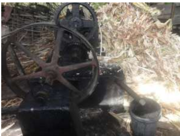
ILUSTRACIÓN N°6: Molienda del Centro Recreacional 7 Pingas.

Modo de preparación: Se deja fermentar al guarapo por 3 días, luego se destila para obtener el trago luego se añade nervio de toro, pollo y paloma lengua y pata de res, becerros (neonatos). Finalmente se añade la fruta para adquirir el sabor de cada bebida.