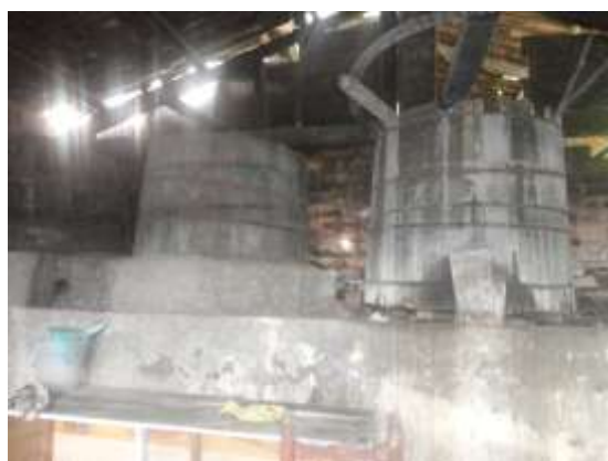
ILUSTRACIÓN N°8: Barriles de madera para la fermentación, del Centro Recreacional 7 Pingas. FUENTE Y AUTOR: Tesista/ Sayda M. Unkuch S.