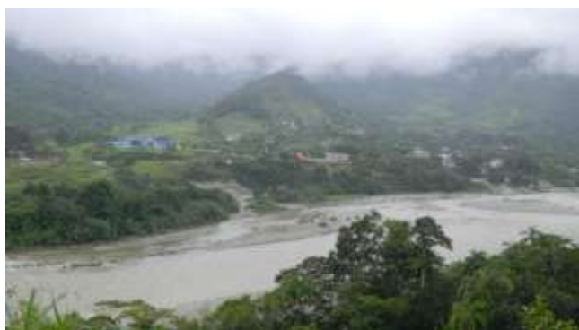
ILUSTRACIÓN N°18: Vista panorámica del Mirador. FUENTE Y AUTOR: Tesista/ Sayda M. Unkuch S.

En este sector los visitantes, bajaran de la buseta por unos 10 minutos para tomarse fotos.