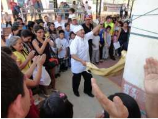
ILUSTRACIÓN N°27: Concurso de la Elaboración de la Melcocha. Espacio Cubierto de Timbara, en sus fiestas abril 2013. Siendo ganador el propietario de la Molienda del Tío Juan.

FUENTE Y AUTOR: Tesista/ Sayda M. Unkuch S.