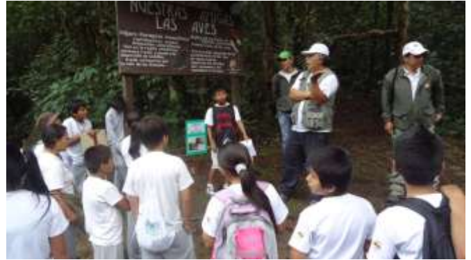
ILUSTRACIÓN N°15: Sendero, sector las aves. FUENTE Y AUTOR: Tesista/ Sayda M. Unkuch S.