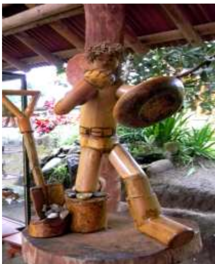
ILUSTRACIÓN N°25: Monumento El Minero; elaborado en guadúa. FUENTE Y AUTOR: Tesista/ Sayda M. Unkuch S.

Como proyectos futuros tiene realizar una cabaña destinada para hospedaje con materiales propios del medio y especialmente utilizando la guadúa.