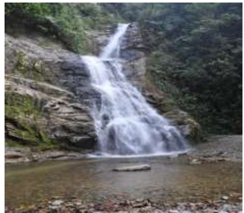
ILUSTRACIÓN N°17: Cascada la Poderosa.

Luego de recorrer el Parque Nacional Podocarpus (Bombuscaro); también conocida como la Reserva de la Biosfera, nos embarcamos en la buseta para partir en un viaje de aproximadamente 30 minutos hacia la Parroquia Timbara, para visitar sus atractivos turísticos; que se ha considerado de mucha importancia incluirla en este Circuito Ecoturístico para difundir y dar realce al turismo comunitario que promueve esta Parroquia,