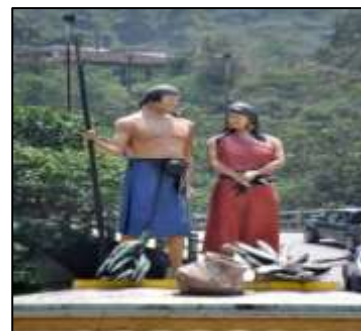
ILUSTRACIÓN N°12: Monumento Etnia Shuar. FUENTE Y AUTOR: Tesista/ Sayda M. Unkuch S.

Monumento Etnia Shuar: Ubicado en el redondel del puente sobre el río Zamora, la mayor dificultad es no poder precisar sobre esta Etnia, ya que carece de escritura y ellos ni siquiera usaron los jeroglíficos de otros pueblos. Escultura realizada por el maestro Fabián Figueroa.