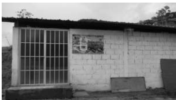
ILUSTRACIÓN N°19: Instalaciones de la Envasadora Podocarpus.

Continuando con el recorrido, volvemos a subirnos a la buseta y continuar la ruta hacia Timbara, en el trayecto observamos desde la buseta la Planta procesadora del agua purificada y envasada Podocarpus. Importante empresa familiar, que aporta con trabajo a la gente local y al desarrollo de la Parroquia Timbara. También debemos recalcar que uno de los objetivos de esta empresa es difundir el cuidado y la importancia de la flora y fauna el Parque Nacional Podocarpus.