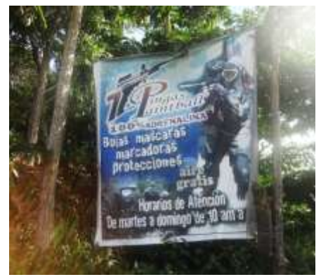
ILUSTRACIÓN N°5: Cancha de Paintball del Centro Recreacional 7 Pingas.