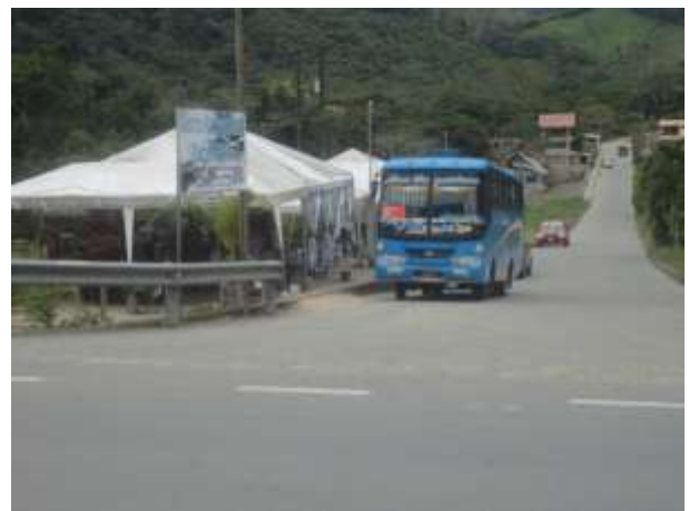
ILUSTRACIÓN N°2: Entrada a la Junta Parroquial de Timbara.