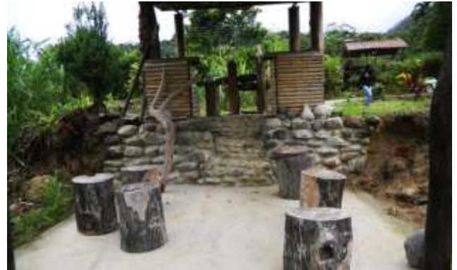
ILUSTRACIÓN N°24: Trapiche Artesanal del Fogón Verde.

Continuamos caminando unos 10 metros más siguiendo la carretera hacia la Parroquia Timbara y visitamos La casita de Bambú (Artesanías de Guadúa); su propietario nos compartirá las actividades que desarrolla esta empresa familiar: entre las principales tenemos la elaboración de artesanías en guadúa y también dicta seminarios fuera y dentro de la ciudad con este mismo tema para fomentar la importancia de valorar lo nuestro. Otra de las actividades que realiza es el cultivo de plantas como papaya, maíz, hortalizas con abono orgánico que el mismo lo prepara, estos productos son sacados a la venta en la feria del día domingo en la ciudad de Zamora. Al frente de esta cabaña se puede disfrutar de la playa.