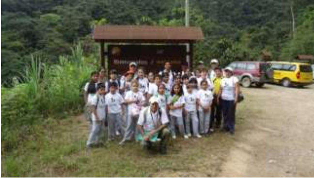
ILUSTRACIÓN N°14: Entrada al Parque Nacional Podocarpus. FUENTE Y AUTOR: Tesista/ Sayda M. Unkuch S.

guardaparques que son los guías, oficinas del parque para guardar equipajes, cocina para grupos pequeños. Los guardaparques en las oficinas tienen todo el material necesario sobre el parque, para informar y guiar a los visitantes.