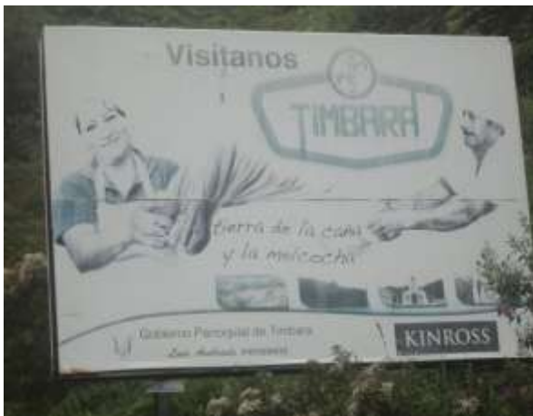
ILUSTRACIÓN N°1: Valla Publicitaria, en la Avenida Principal.

El Circuito Ecoturístico empieza en la Parroquia Timbara, en el Centro Recreacional 7 pingas y termina en la Asociación de Comidas Típicas Amor y Fortaleza de la Parroquia Timbara.