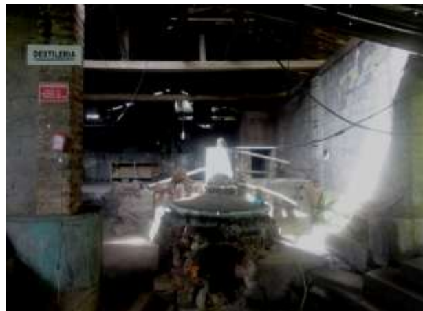
ILUSTRACIÓN N°7: Planta de destilería del Centro Recreacional 7 Pingas. FUENTE Y AUTOR: Tesista/ Sayda M. Unkuch S.