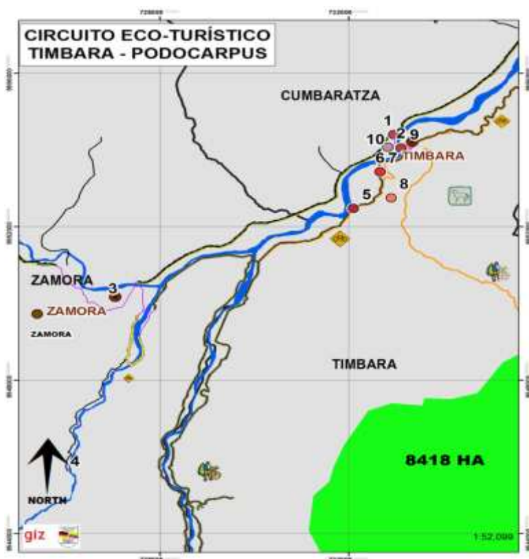
Mapa N°1: Recorrido del Circuito Ecoturístico Timbara-Podocarpus.

Tiempo estimado total de duración del circuito: 5 horas, tomando en cuenta tiempo por razones de algunas circunstancias e imprevistos.