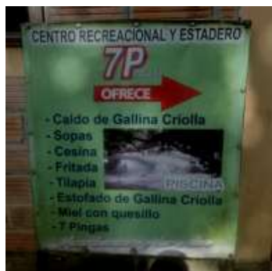
ILUSTRACIÓN N°4: Servicios que ofrece el Centro Recreacional 7 Pingas.