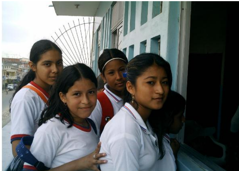
Alumnas del colegio particular mixto "Hispano América".