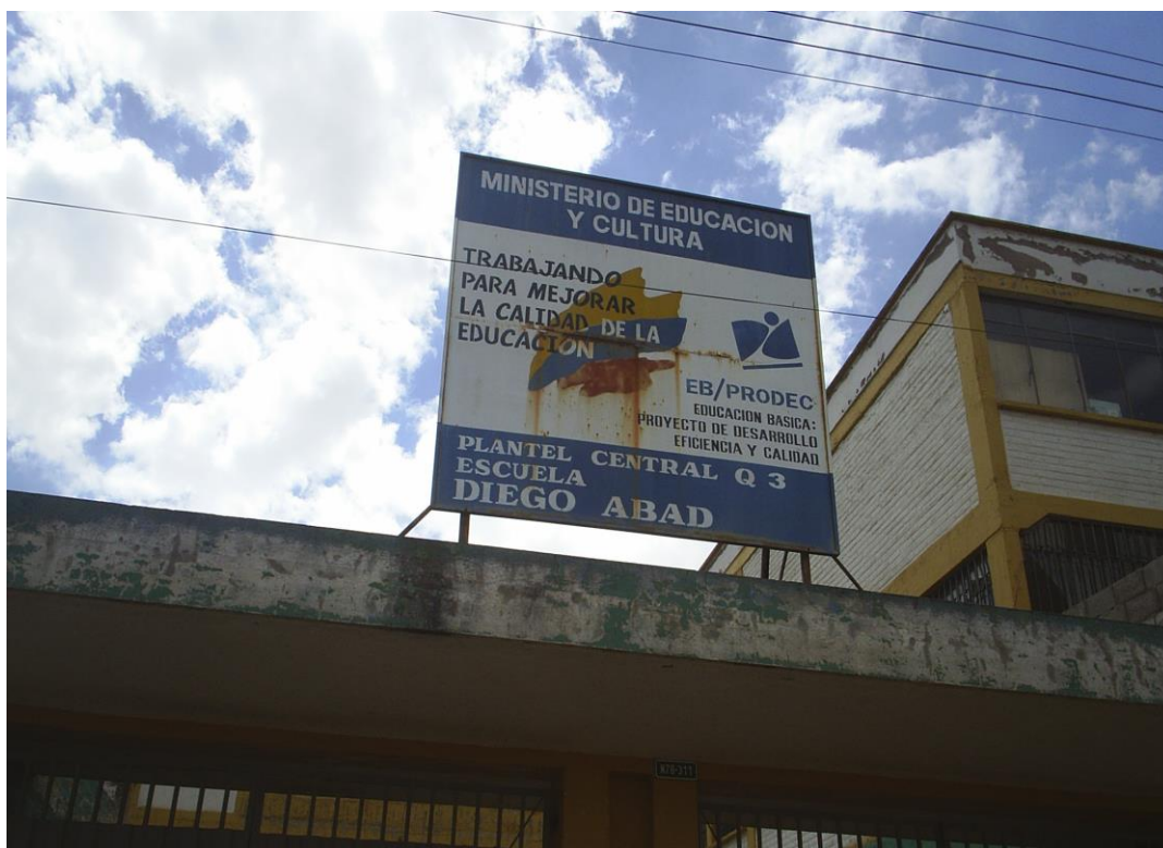
Foto N° 2 Vista exterior del Planteo Central Q3 Diego Abad de Cepeda.

Las motivaciones son base importante en el desarrollo de esta labor; pero el eje trascendental que nos impulsó a seguir en la tarea es conocer que como maestros podemos impulsar cambios que de hecho ya los estamos consiguiendo al ser orientadores y guías de nuevos conocimientos y hemos desechado el modelo tradicional al que por años habíamos estado arraigados. Solamente el concienciar a nuestros compañeros del rol fundamental que cumplimos en la vida, el don sagrado que Dios depositó en nosotros es lo que nos ayuda a seguir en esta tarea. Las adversidades están presentes en todo momento y una de las más grandes que se nos presentó fue el desinterés de algunos compañeros en colaborar con las encuestas y entrevistas, especialmente en las escuelas fiscales, donde priman los intereses personales y muy pocos los que en realidad pueden ayudar a toda la comunidad educativa. Directores que no tienen autoridad, profesores con poco interés de colaborar con esta investigación y sobre todo la falta de comunicación entre todos los involucrados.