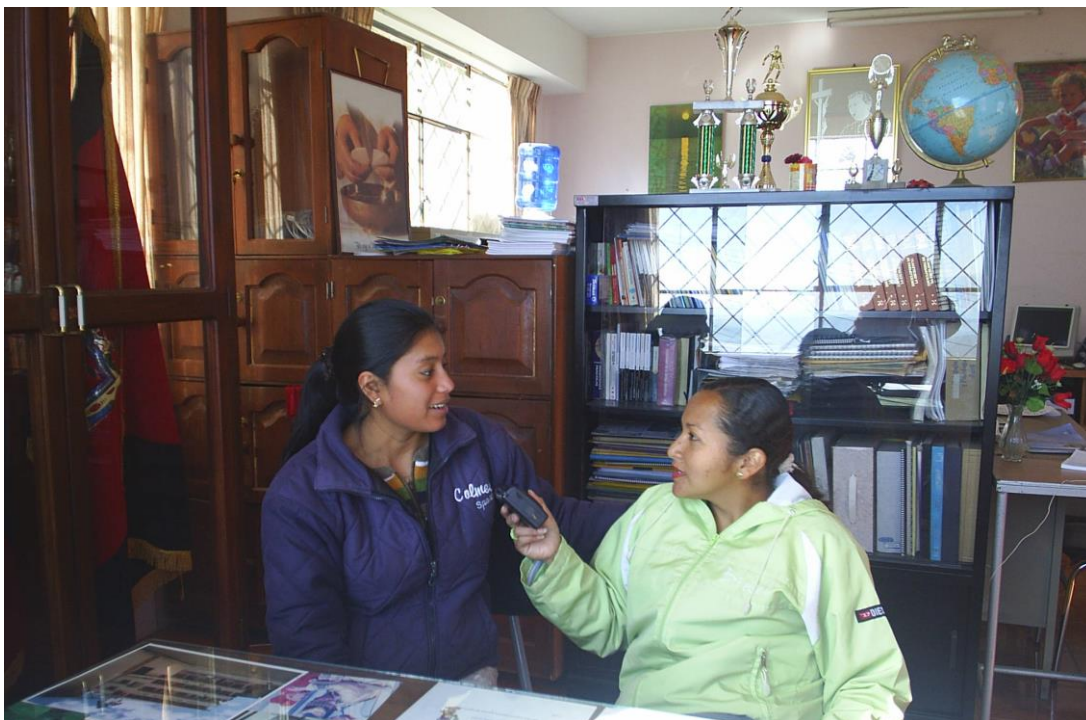
Fotos N° 5 y 6 Entrevista con el personal de la Institución Particular.

contenido presentamos fotografías de nuestras entrevistas para justificar lo anteriormente expuesto.