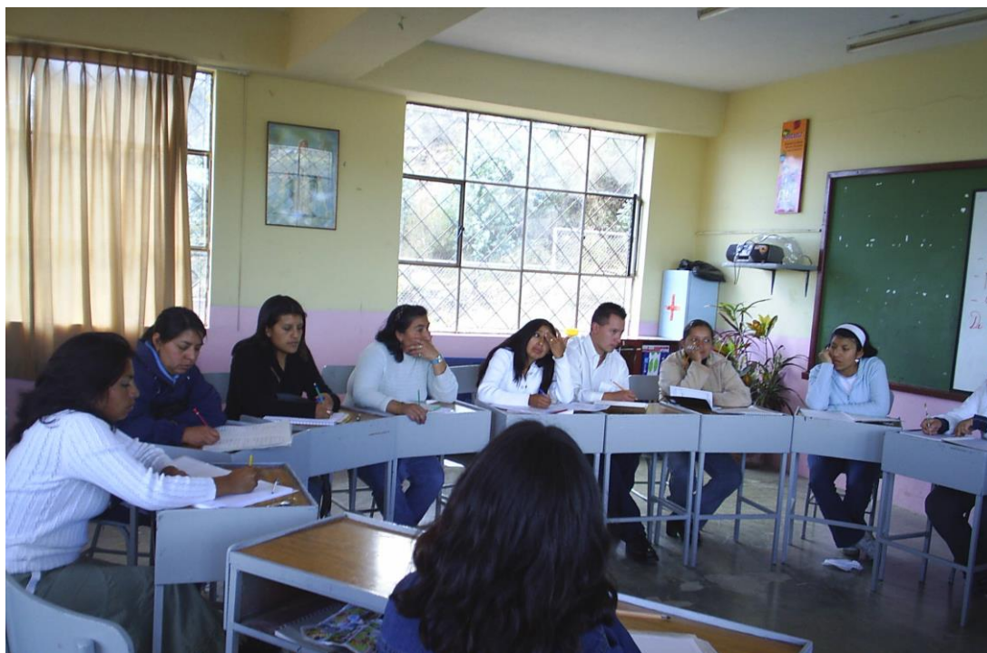
Fotos N° 3 y 4 Encuesta aplicada a los docentes de la Esc. Monseñor Antonio González.

Aquí dos fotografías que demuestran la aplicación de nuestra encuesta.