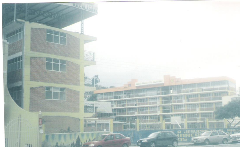
Figura No 1. Unidad Educativa “Calasanz” ciudad de Loja.