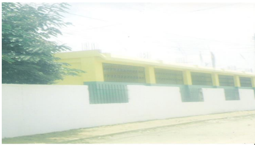
Figura No. 4 Escuela Fiscal Mixta “Matilde Hidalgo de Procel”-- Huaquillas