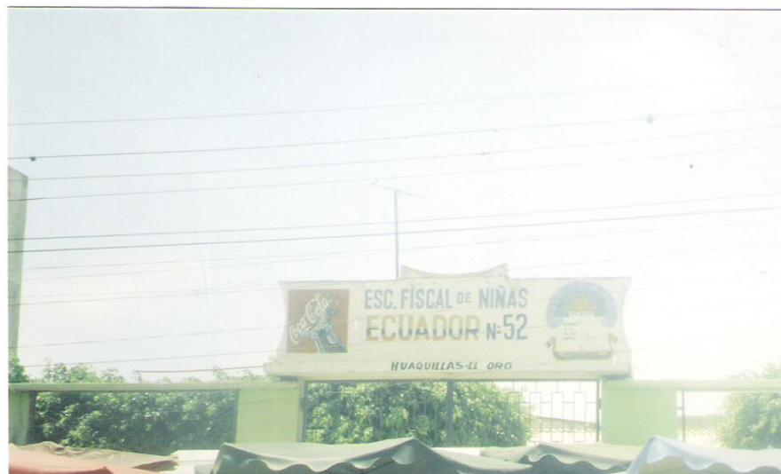
Figura No. 3 Escuela Fiscal “Ecuador”-- Huaquillas