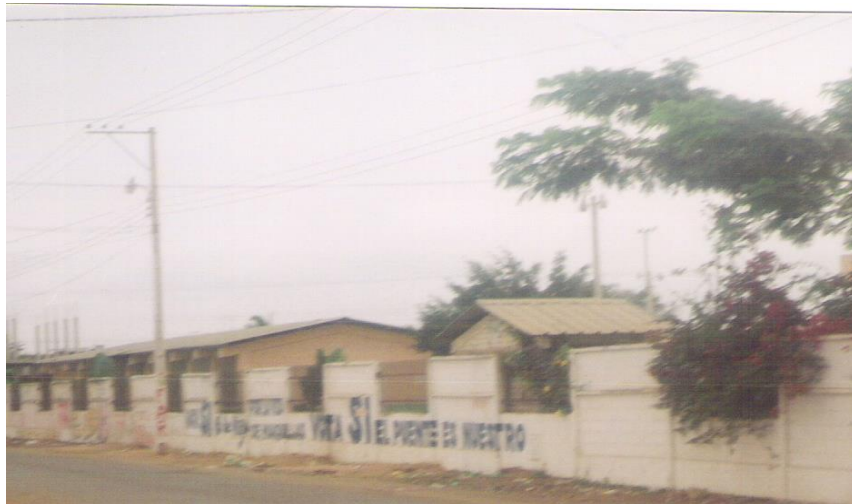
Figura No 2. Escuela Fiscal Mixta “General Vicente Anda Aguirre”.- Huaquillas