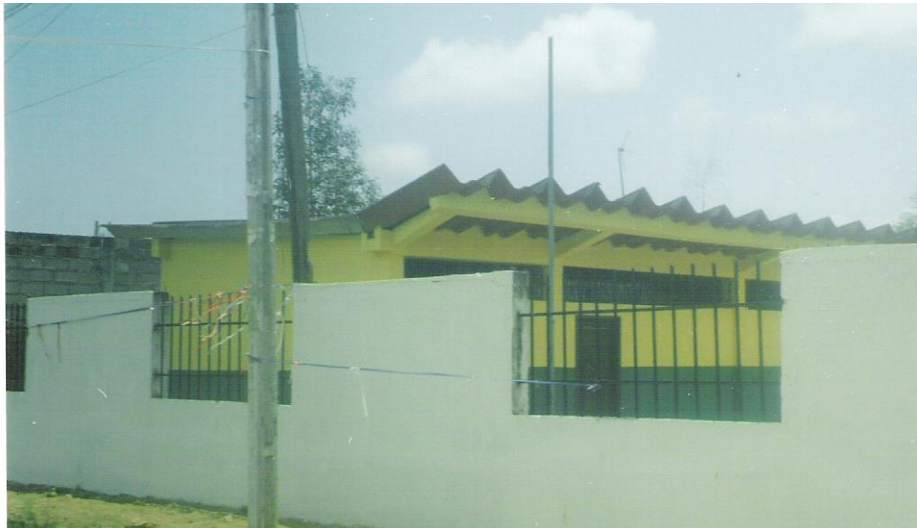
Figura No. 7 Escuela Fiscal Mixta “Primero de Octubre”-- Huaquillas