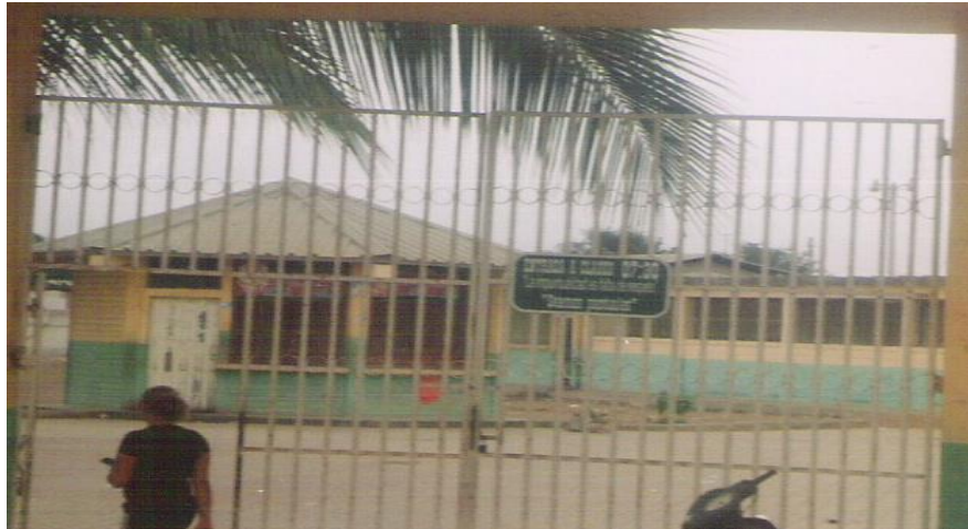
Figura No. 6 Escuela Fiscal Mixta “José Anselmo García”-- Huaquillas