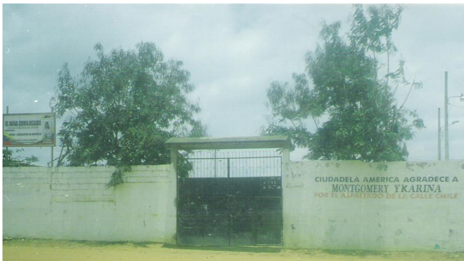
Figura No. 10 Escuela Fiscal Mixta “Ciudad y Arenillas”-- Arenillas

Profesores participantes: En este proceso investigativo participaron un total de 70 docentes, distribuidos de la siguiente manera: 35 docentes de la Unidad Educativa Calasanz de la ciudad de Loja; de la ciudad de Huaquillas: General Vicente Anda Aguirre 1 profesor, Matilde Hidalgo de Procel 1 docente, Clotario Iñiguez 1 profesor, escuela Ecuador 1 docente, Froilan Suquinagua Bermeo 2 docentes, José Anselmo García Cajamarca 3 docentes, Primero de Octubre 13 docentes; del cantón Arenillas: Escuela Ciudad de Arenillas 1 docente, Juan Montalvo 2 docentes, Once de Noviembre 10 docentes,