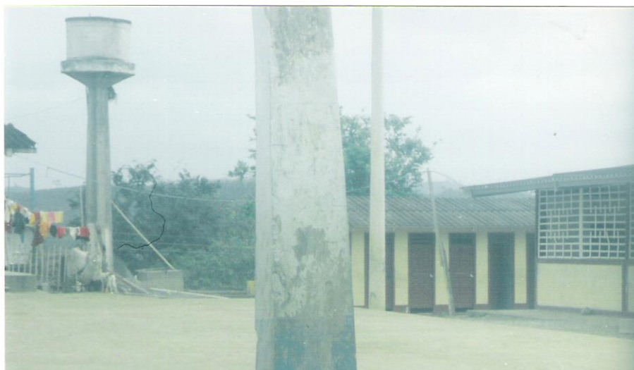
Figura No. 8 Escuela Fiscal Mixta “Juan Montalvo”-- Arenillas