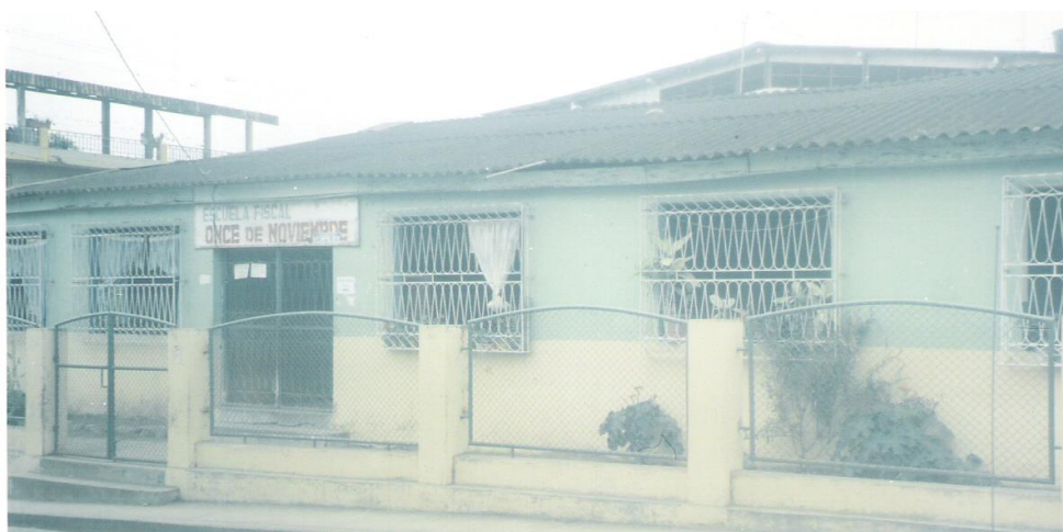
Figura No. 9 Escuela Fiscal “Once de Noviembre”- . Arenillas