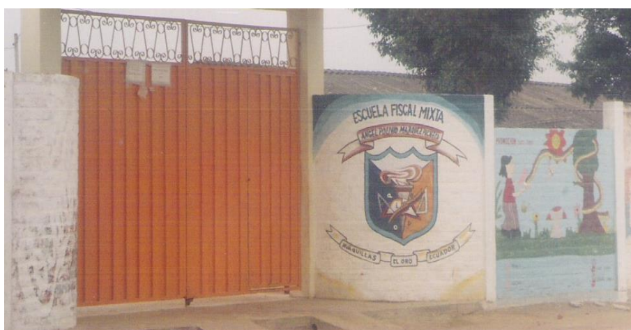
Figura No. 5 Escuela Fiscal Mixta “Froilan Saquinagua Bermeo”-- Huaquillas