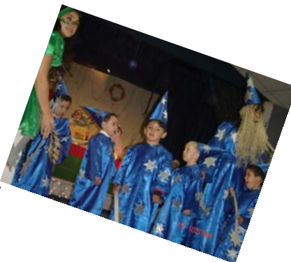
Participación activa de la familia