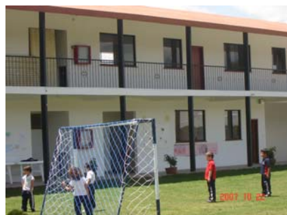
Desarrollo intelectual y físico