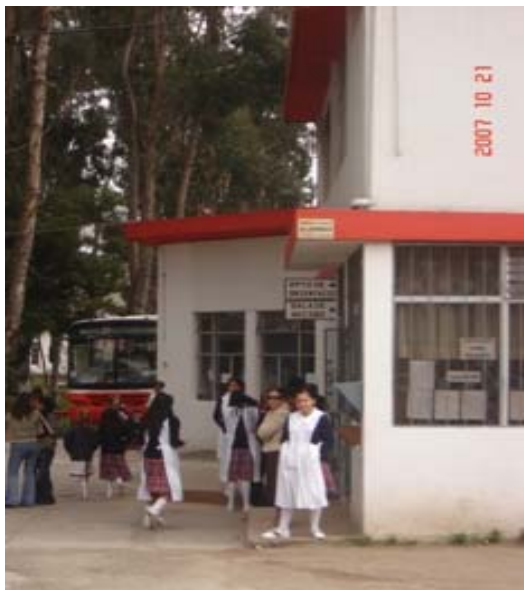
Las estudiantes, hacia una transformación académica, pedagógica y social de la educación