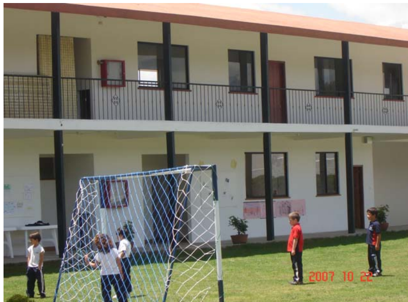
El desarrollo de una mente y cuerpo sano inculcando el amor por los deportes.