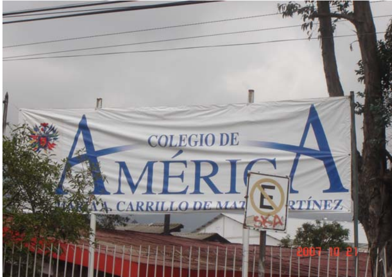
Colegio de América ubicado en la Av. el Inca en la ciudad de Quito Ecuador