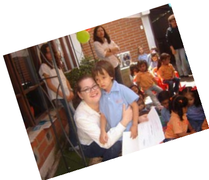
Amor y vocación del maestro