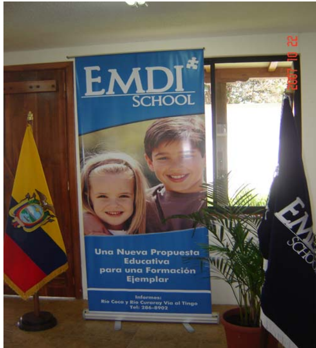
La propuesta de EMDI School propone una formación ejemplar