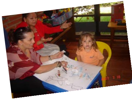
Didácticas en los procesos de aprendizaje