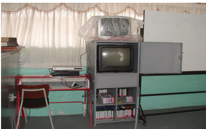
Sala de Audio Visuales de la Escuela Fiscal Mixta “Humberto Vacas Gómez”, donde se albergan más de 500 estudiantes del Sector de la Loma de Puengasí.

Además de las computadoras, también tenemos las otras herramientas de comunicación e información, tales como el empleo de televisores, videos, cds, VHS, DVD, Cámaras fotográficas, etc