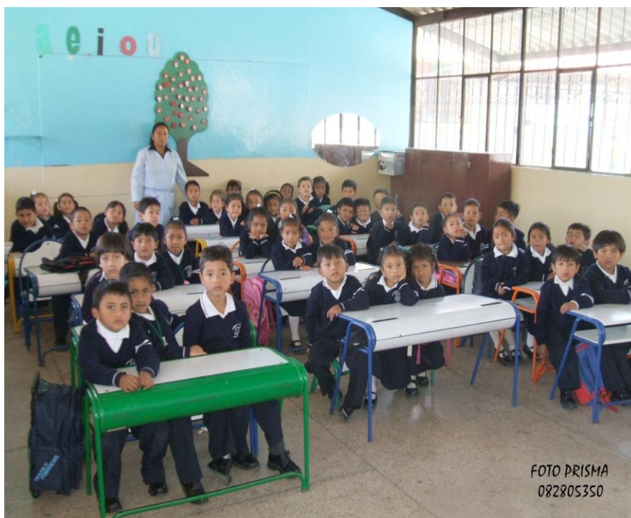
Niños de segundo año de Educación Básica, conformado por 48 estudiantes.

El mayor problema que se tiene sobre todo en establecimientos educativos que cuentan con elevado número de estudiantes, aulas que superan los 50 alumnos, la falta de atención del Estado en muchos casos para la creación de partidas docentes que nos permitan fortalecer la educación en la zona rural e ir transformando las instituciones uní docentes en pluridocentes, llenando las vacantes en otras instituciones en las que faltan profesores, como también dotar de recursos necesarios para lograr una adecuada educación, la falta de tiempo que se tiene para evaluar o corregir las mismas, a pesar del gran esfuerzo o profesionalismo que tengan los maestros o maestras en cada una de las áreas, en muchos casos no logran calificar por completos los trabajos o evaluaciones periódicas o permanentes; en otros casos estas tareas son llevadas a casa por parte de los maestros, para continuar con la revisión de las mismas y de esta manera cumplir con el objetivo de la evaluación.