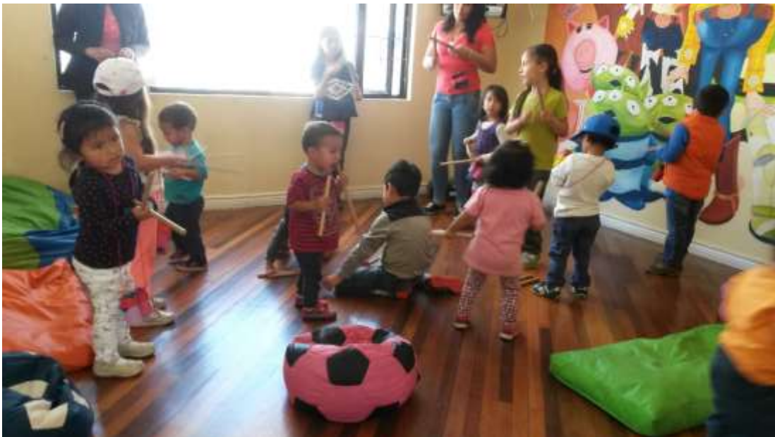
Imagen 16 (Expresión musical)