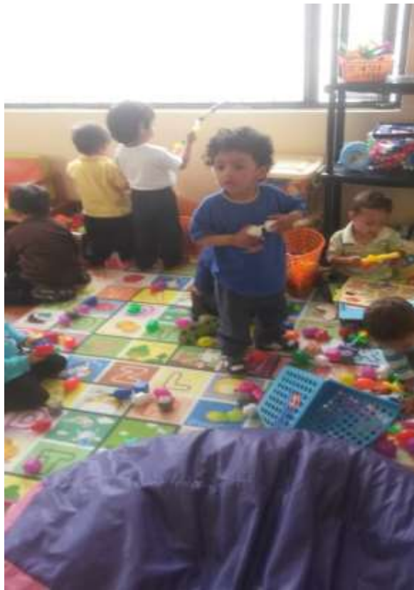
Imagen 6 (Juegos libres)