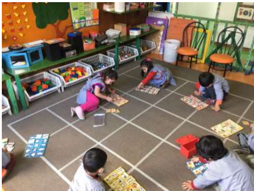
Imagen 1 (Juegos libres)