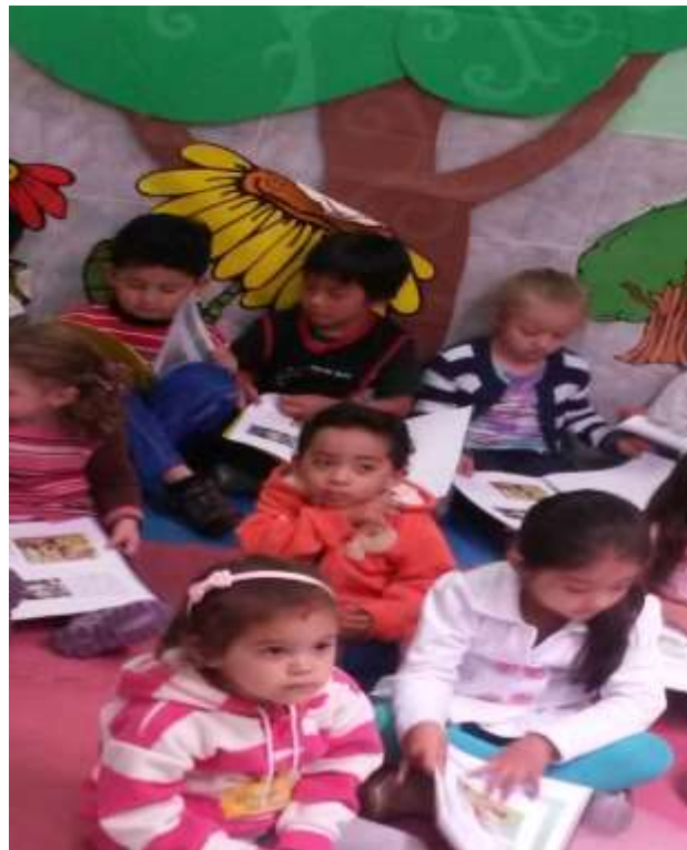
Imagen 8 (Rincón de Lectura)