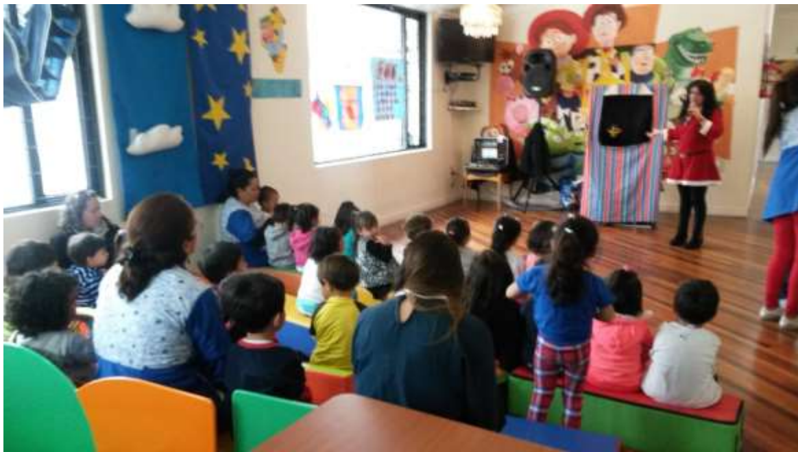
Imagen 10 (Actividades libres)