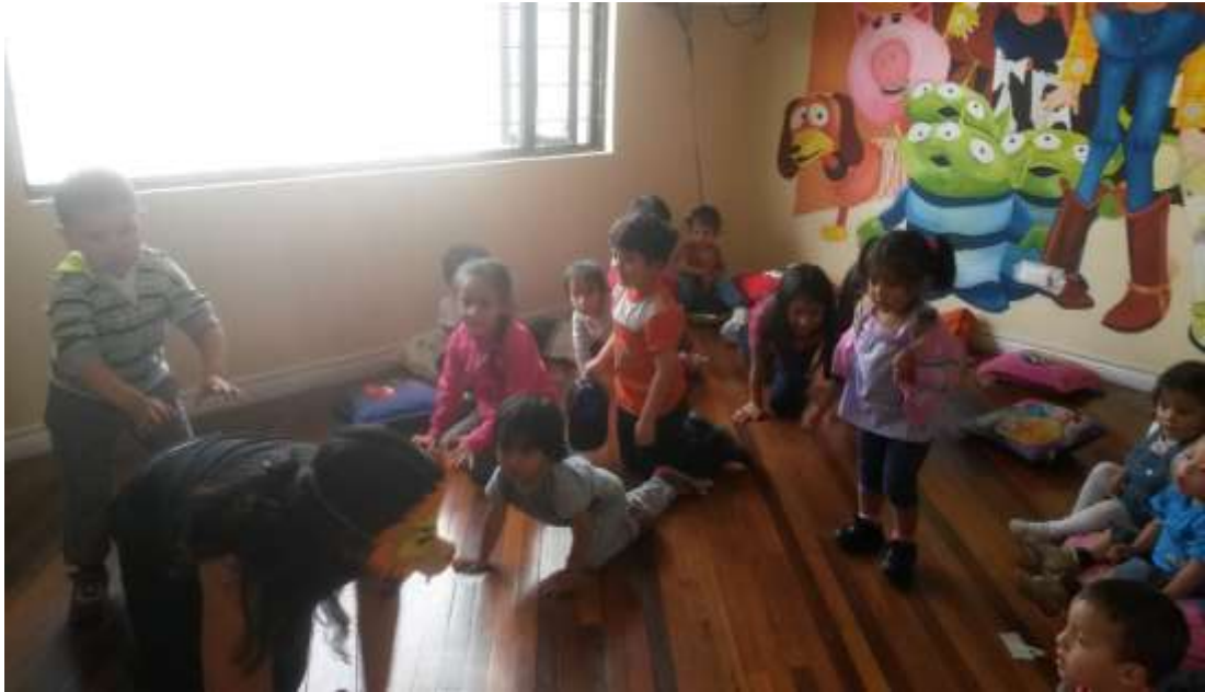
Imagen 7 (Expresión corporal)