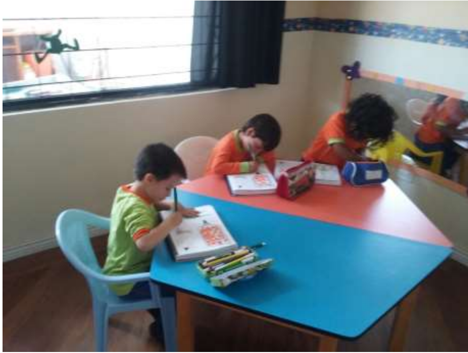
Imagen 15 (Nociones de correspondencia)