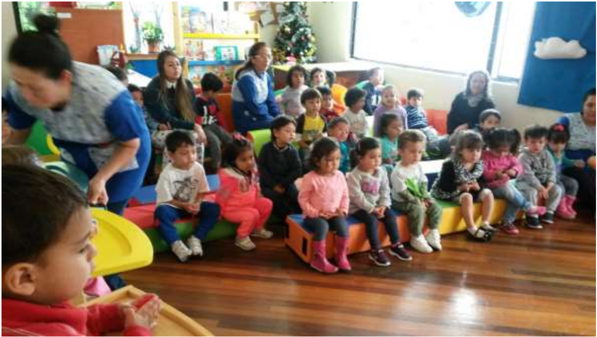
Imagen 11 (Actividades libres)