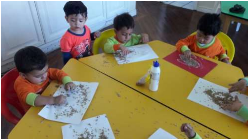
Imagen 14 (Reconociendo texturas)