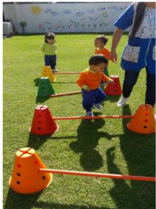
Imagen 12 (Motricidad gruesa)