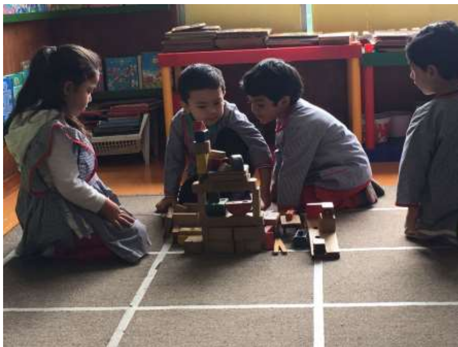
Imagen 4 (Motricidad fina)