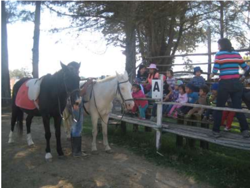
Imagen 17 (Estimulación temprana con caballos)