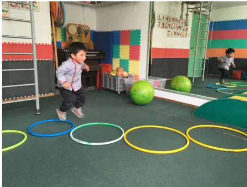
Imagen 3 (Motricidad gruesa)