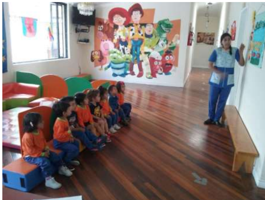
Imagen 18 (Grafología)