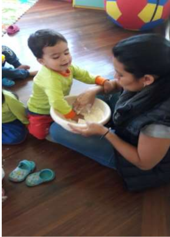
Imagen 13 (Reconociendo texturas)