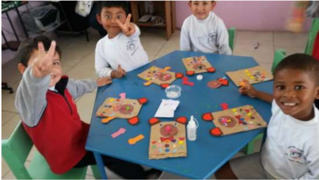
Imagen 9 (Motricidad fina)