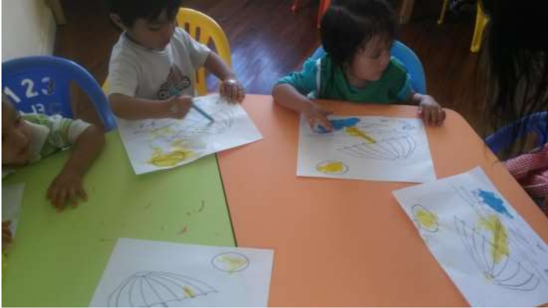
Imagen 5 (Expresión plástica) Fuente: Arévalo, B. (2017)