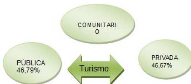
Ilustración 1 Sistema turístico del cantón Pastaza

Según la Directora del Ministerio de Turismo de Pastaza (2016), para el caso del sector privado, se han organizado desde el 2005 hasta el año 2015 en asociaciones y gremios que buscan objetivos comunes; como es el caso de AHOTEP, ASATUP, AGUITURPAS; CAPTUR, AGENTURPAS, Asociación de emprendedores; Asociación de bares y karaokes. Así mismo el sector Público representando por el Ministerio de Turismo; GAD Prefectura de Pastaza, Municipalidad de Pastaza, Santa Clara, Mera, Arajuno; Mesa de turismo, por último pero no menos importante el turismo comunitario considerado así ya reúne varias comunidades indígenas de Pastaza.