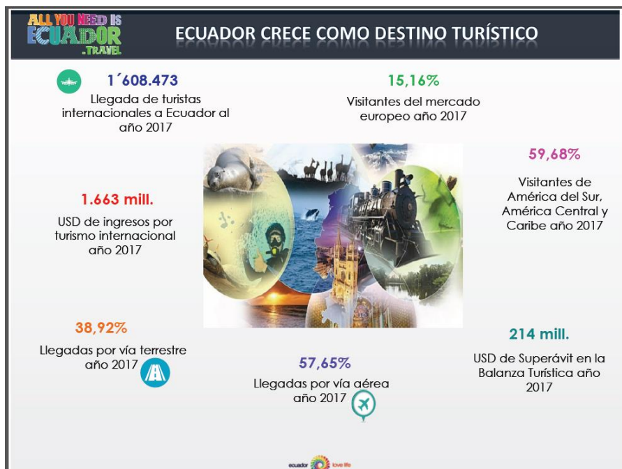
Figura 1. Ecuador crece como destino turístico

Para activar al Turismo Comunitario en nuestro país es fundamental contar con una promoción y mercadeo estratégico tanto a escala nacional y mundial. El proceso de planificación turística de la comunidad debería involucrar a todos los sectores dando fuerza a los principios de la sostenibilidad y trabajando bajo el contexto de la agenda local 21 para que exista un proyecto que fundamente el desarrollo del turismo comunitario dentro de la comunidad y que esté orientado al relevamiento y evaluación de las potencialidades turísticas de los bienes no solo patrimoniales sino naturales.