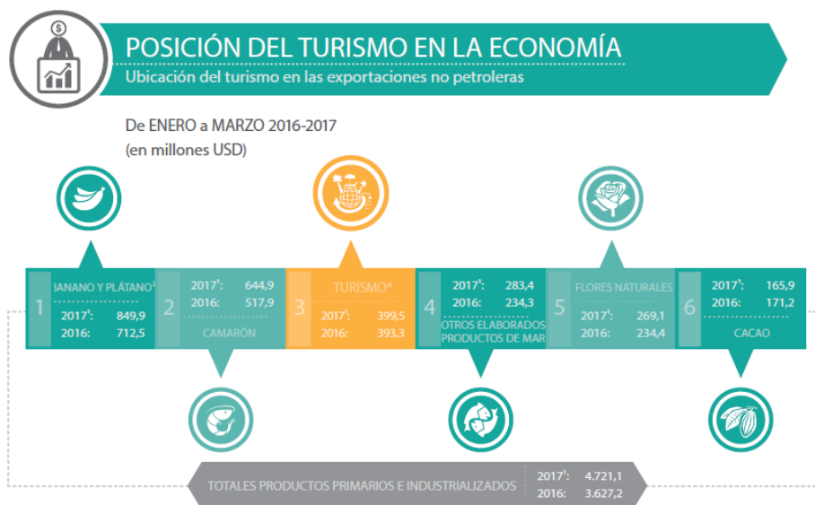
Tabla 2. Posición del turismo en la economía

*Cifras provisionales; su reproceso se realiza conforme a la recepción de documentos fuente de las operaciones de comercio exterior. **Se basan en las cifras de la Empresa Manufacturas y Banco Central del Ecuador. **Según Balanza de Pagos del Ecuador (Clas. Viajes y Transporte de Pasajeros).