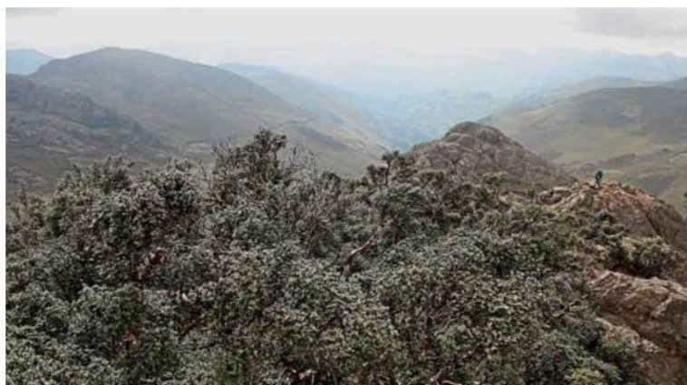
Figura 5. Bosque Polilepys