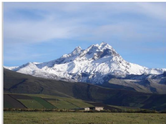
Figura 4. Volcán Carihuairazo