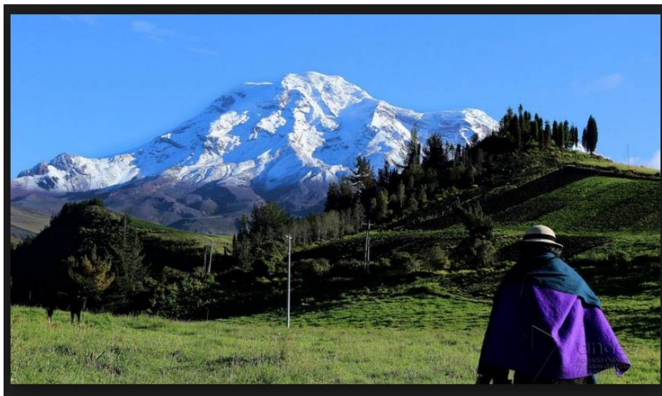
Figura 3. Volcán Chimborazo