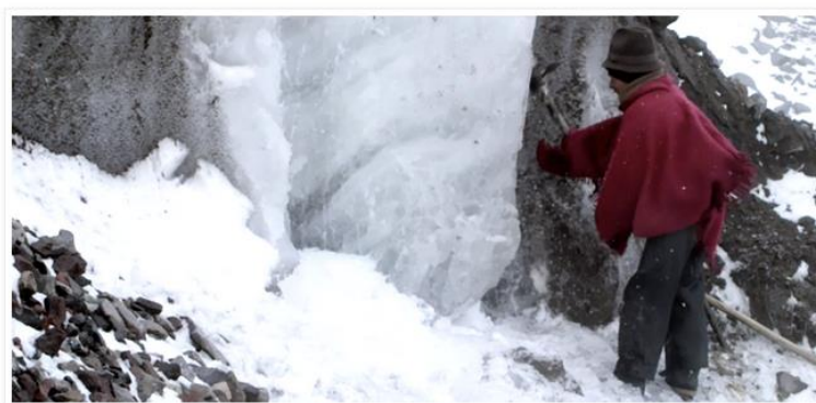
Figura 6. Hieleros del Chimborazo