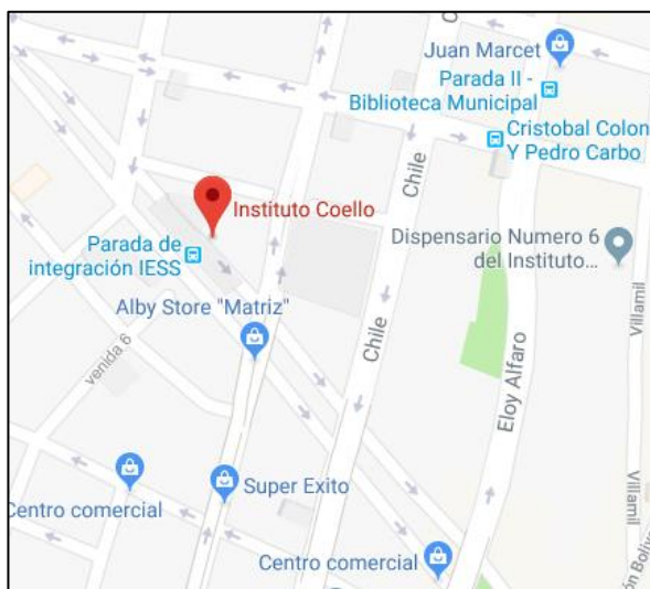
Gráfico 1 Ubicación Colegio Mixto Particular Instituto Coello Elaborado por: La autora

La ubicación del Colegio Mixto Particular Instituto Coello, es la Provincia del Guayas, en el Cantón Guayaquil, en la Avenida Olmedo y Boyacá. A continuación, se expone el mapa de localización utilizando Google Maps: