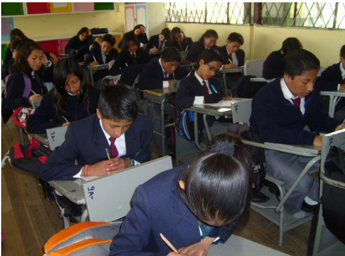
Aplicación de encuestas a Estudiantes de Noveno Año de Educación Básica