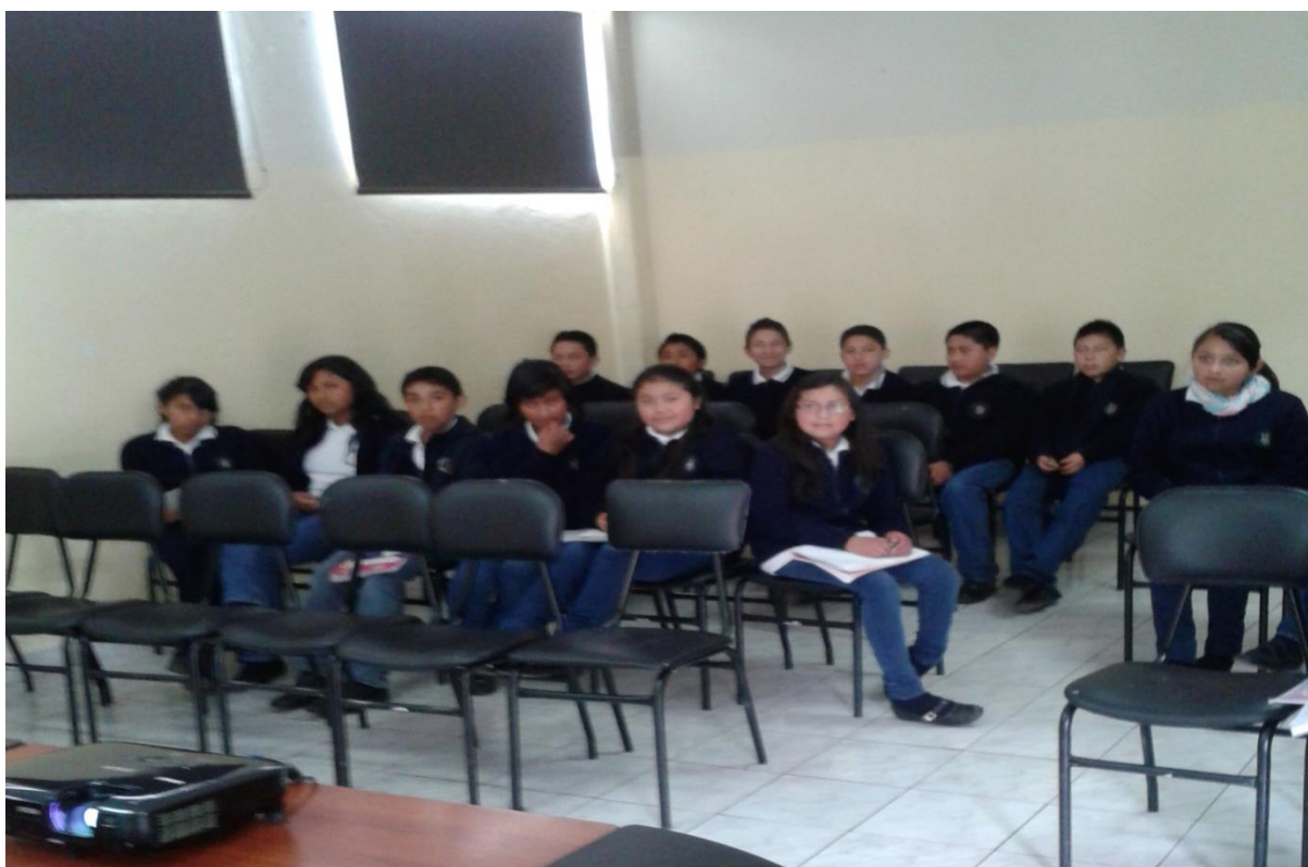
Biblioteca de la Unidad Educativa Municipal Oswaldo Lombeyda