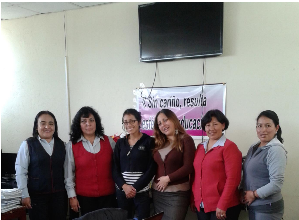
Grupo de docentes encuestadas con la investigadora