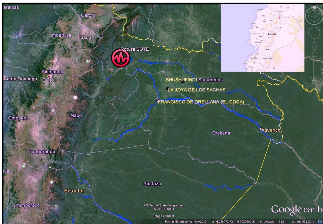
Ilustración 3: Ubicación del Deslizamiento SOTE