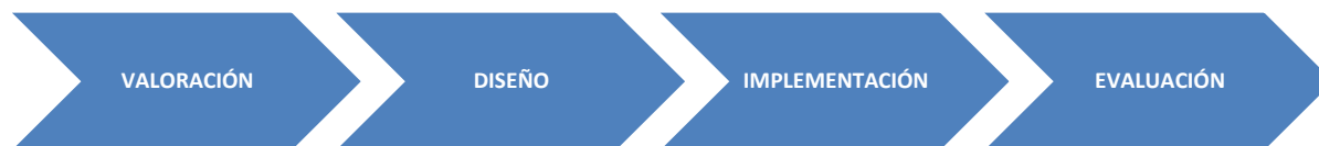
Ilustración 2: Ciclo de Proyectos de Respuesta Humanitaria

Fuente: (Rey Marcos & Urgoiti, MANUAL DE GESTIÓN DEL CICLO DEL PROYECTO EN LA ACCIÓN HUMANITARIA, 2007)