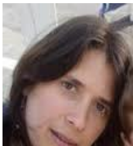
ALICIA YÁNEZ COSSÍO