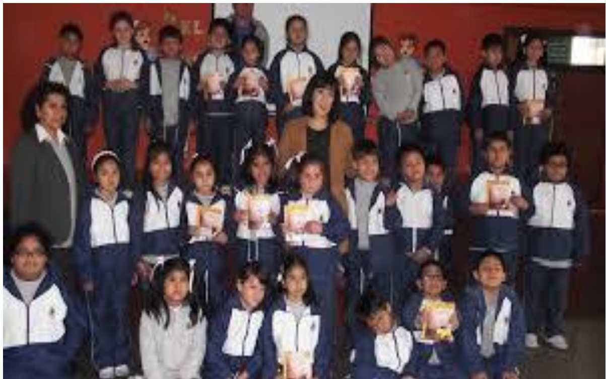
IMAGEN 6: Vista de la escritora María Fernanda Heredia a una institución educativa del sur de Quito para compartir momentos hermosos con la niñez por medio del diálogo interactivo literario.