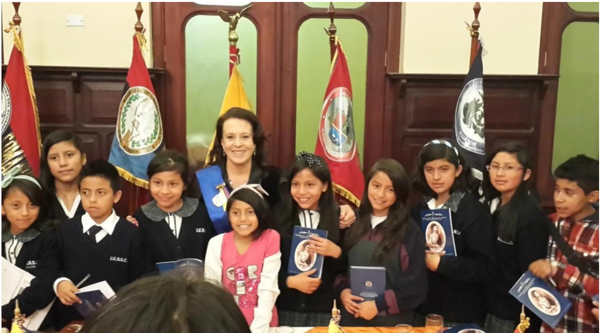
IMAGEN 3: Estudiantes de la Escuela y Colegio Particular Nuestra Señora del Cisne posando con entusiasmo y alegría junto a la escritora Edna Iturralde durante el evento de Condecoración.