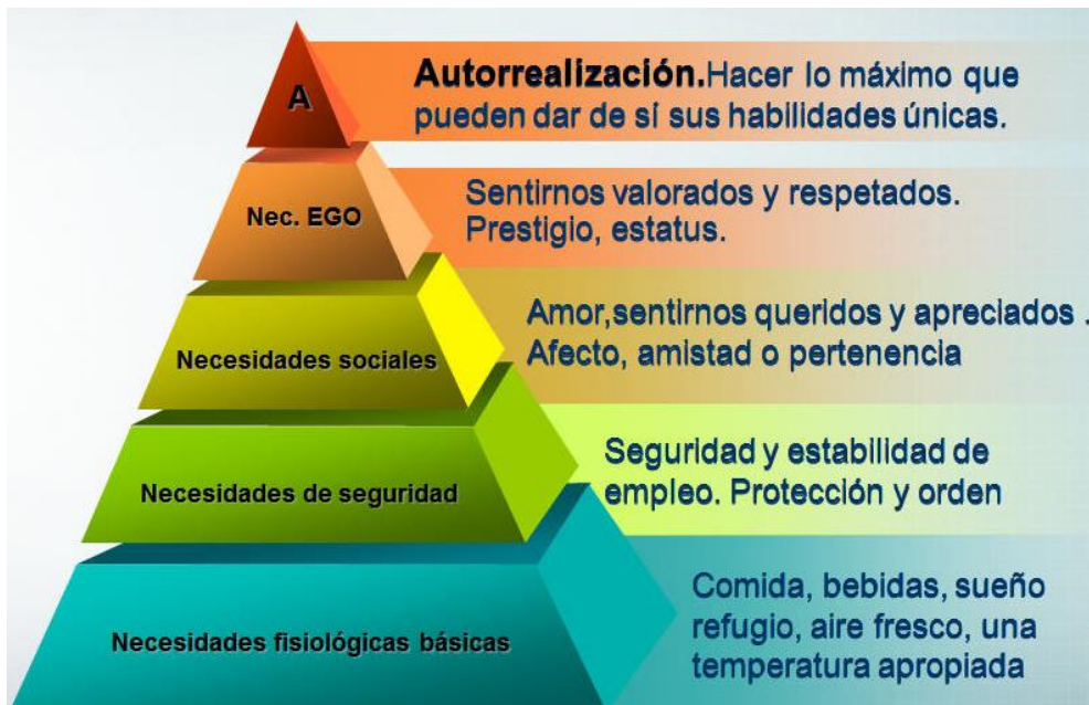
Figura 1. Pirámide de Necesidades Elaboración: Maslow

Estas necesidades no tienen que alcanzarse forzosamente en orden desde el inicio hacia la cúspide, es decir, no implica un alcance ascendente, porque las necesidades fisiológicas nunca dejarán de surgir y satisfacerse.