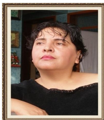
Ilustración N° 3.1