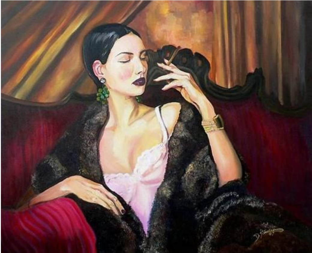
La mujer fatal