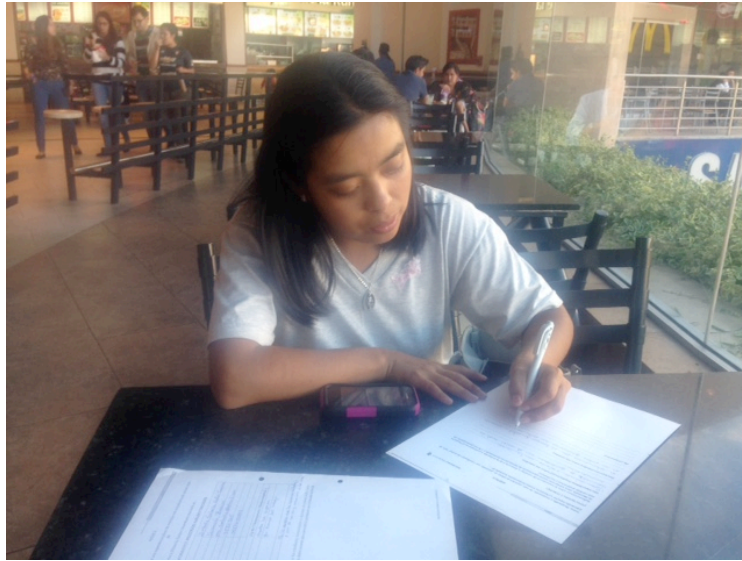
Fuente: Proyecto de Investigación y Mentoría Elaboración: Arroyo Rivas Mireya Isabel