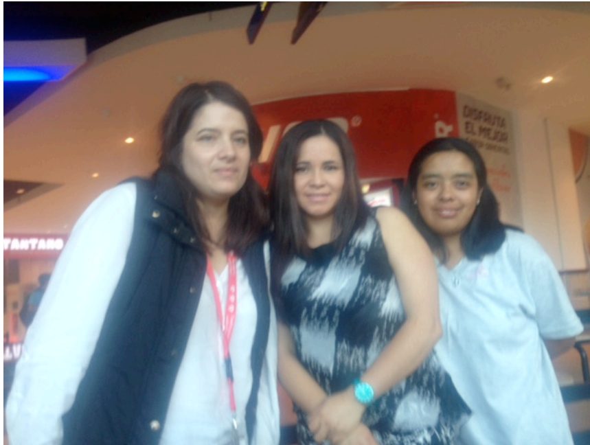
Fuente: Proyecto de Investigación y Mentoría Elaboración: Arroyo Rivas Mireya Isabel