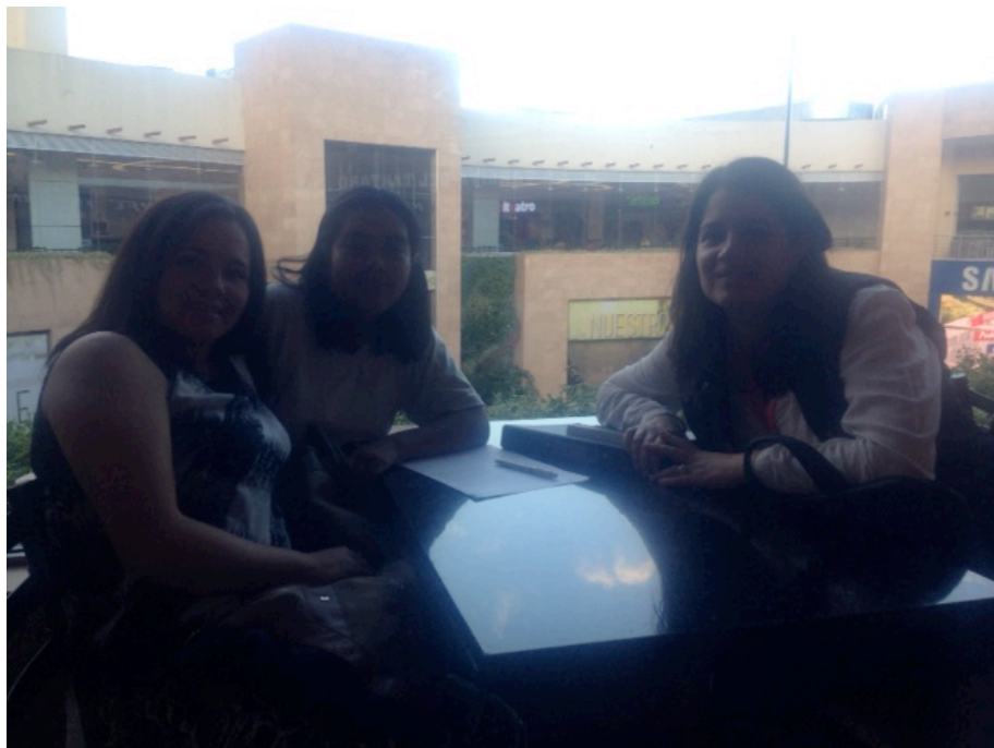
Fuente: Proyecto de Investigación y Mentoría Elaboración: Arroyo Rivas Mireya Isabel