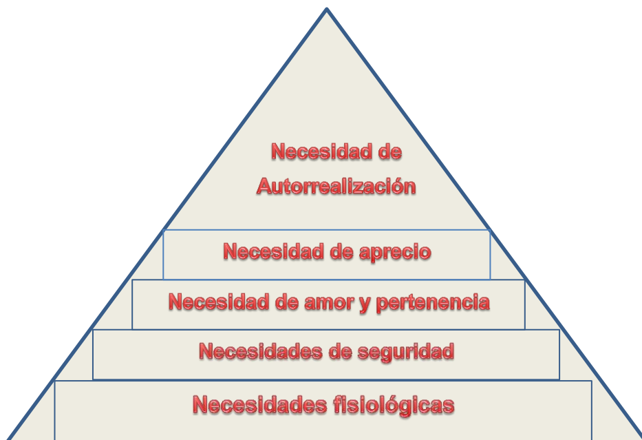
Figura 2. Jerarquía de necesidades, Abraham Maslow.