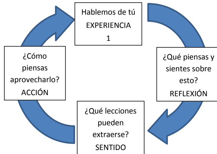
Gráfico 1: Proceso de mentoría