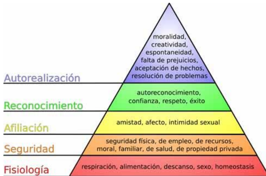
Figura 1: Jerarquía de Maslow