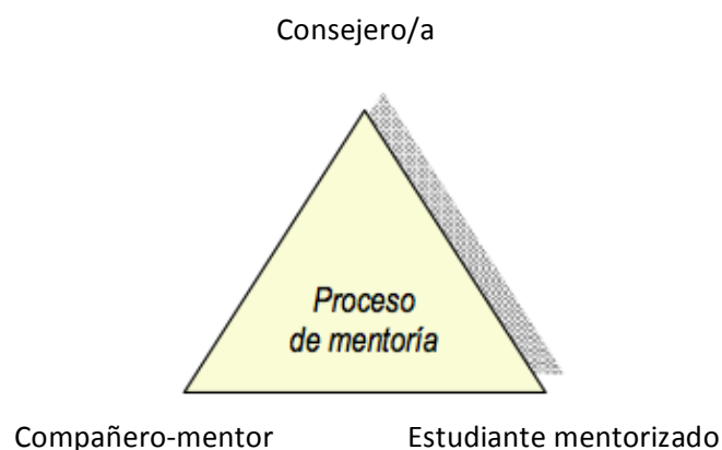
Figura 1: Relación tríadica: consejero, compañero mentor y estudiante Autor: Sistema de orientación tutorial en la UNED

MENTOR/National Mentoring Partnership. (2005), da una descripción clara de cómo deben de estar distribuidos cada uno de los elementos de mentoría, es decir se basa en una tríadica cuyos elementos se distribuyen de la siguiente manera: