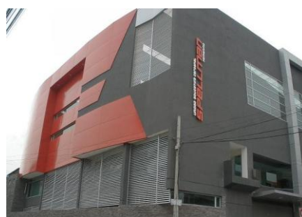
Nuevo Edificio- Parqueadero