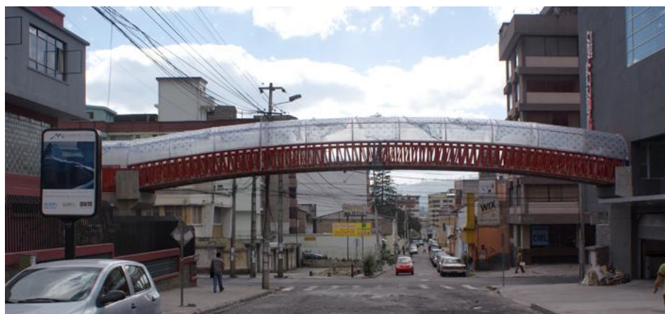
Puente peatonal que une ambos edificios de la Unidad Educativa Cardenal Spellman Femenino