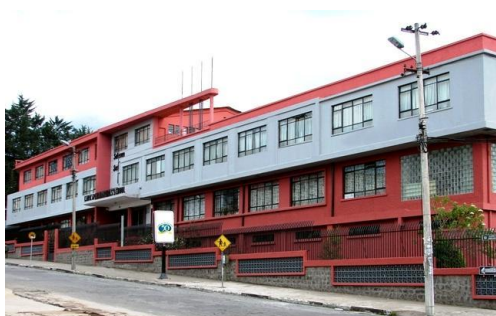
Edificio principal del Colegio Spellman

El edificio nuevo construido en el año lectivo 2008-2009 amplía los servicios anteriormente anotados, un puente elevadizo une la parte antigua con la nueva. (Ver anexo 10)