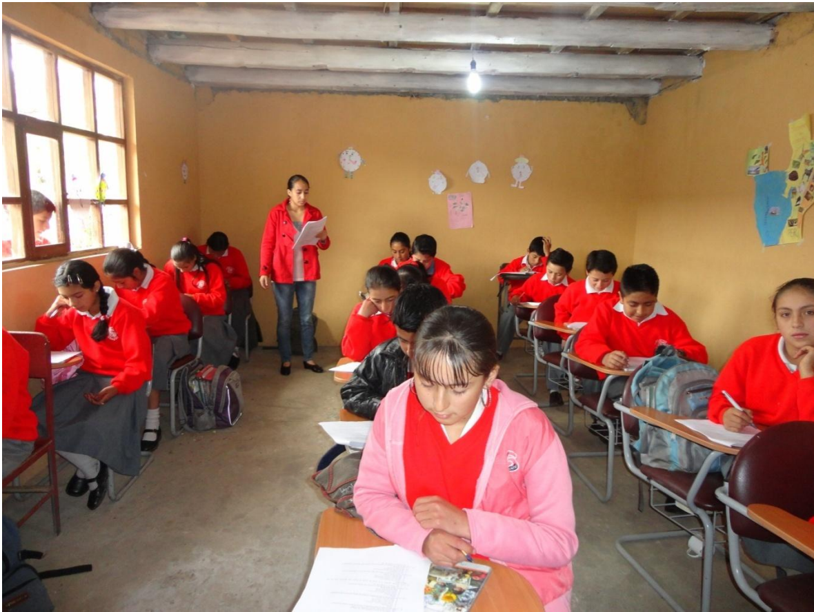
Estudiantes del Colegio Nacional Shaglli