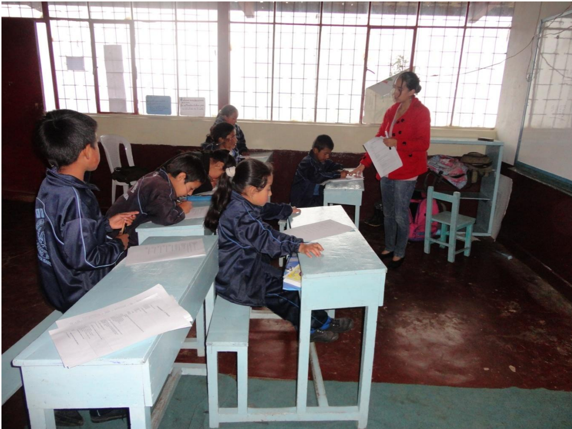
Estudiantes de la Escuela Pedro Unda