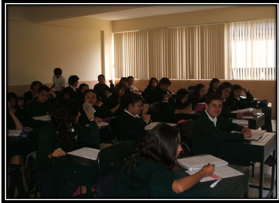
Alumnos del Colegio "Pedro Frías Carrasco"