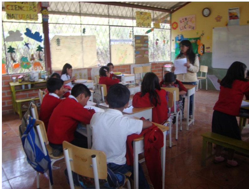
La maestra acompaña a los niños durante la aplicación del cuestionario para que éste sea llenado correctamente