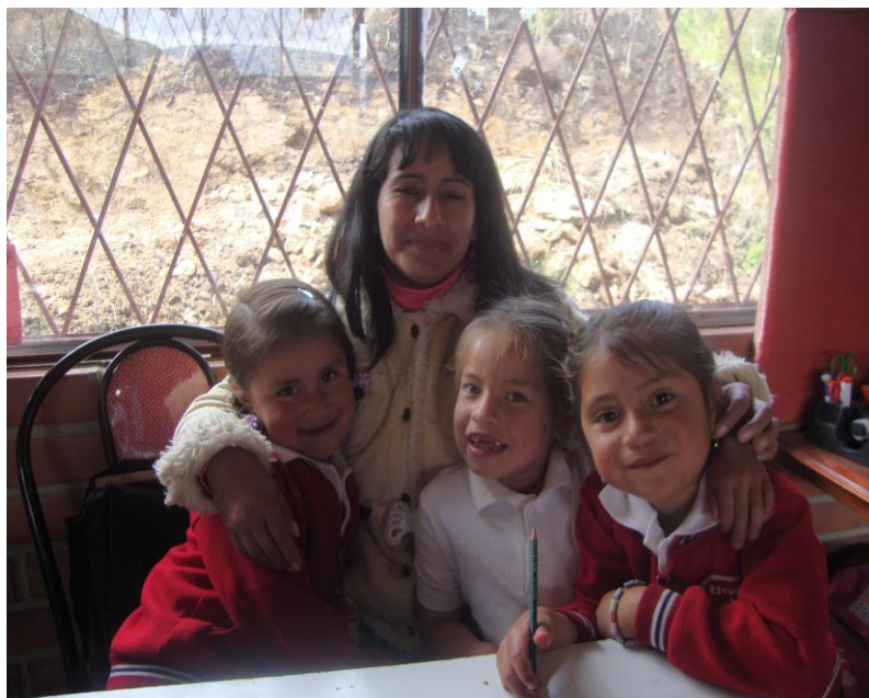
El lugar denota que está lleno de mucho cariño y afecto por parte de niños y docentes.