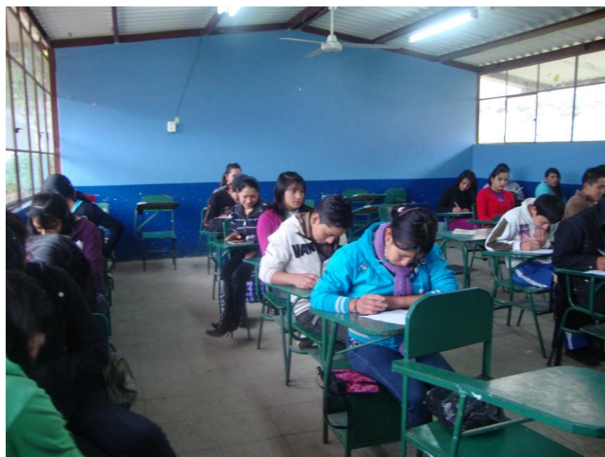
Grupo de jóvenes y señoritas del Primero de Bachillerato respondiendo a los cuestionarios.