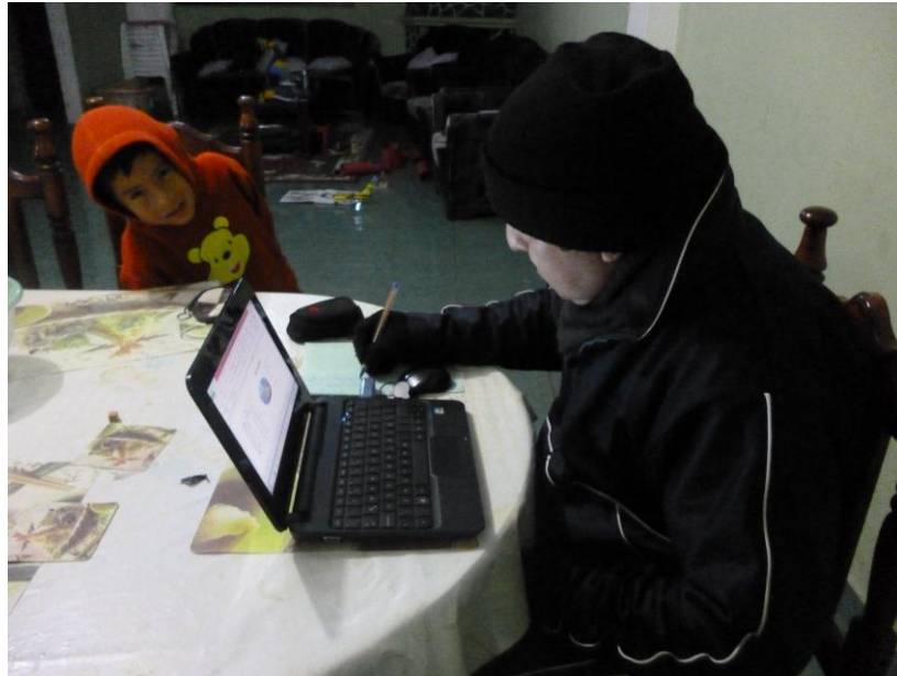
Realizando el análisis e interpretación de datos