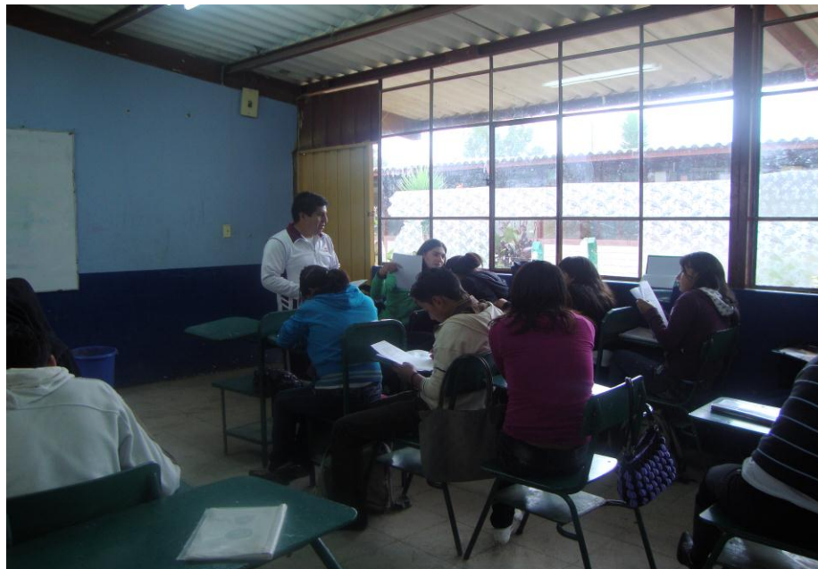
Jóvenes y señoritas de la UEDA Extensión Sígsig junto a su Tutor llenando el cuestionario 2.