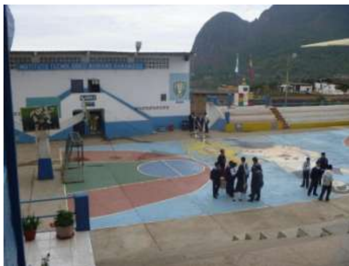
Foto Nro. 6 Alumnos del Instituto Tecnológico Superior Fiscomisional “Mariano Samaniego”