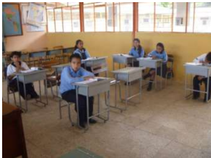
Foto No. 4 Alumnos de 7mo.año de EGB Escuela Fiscal “Mustiola Cueva de Reyes”