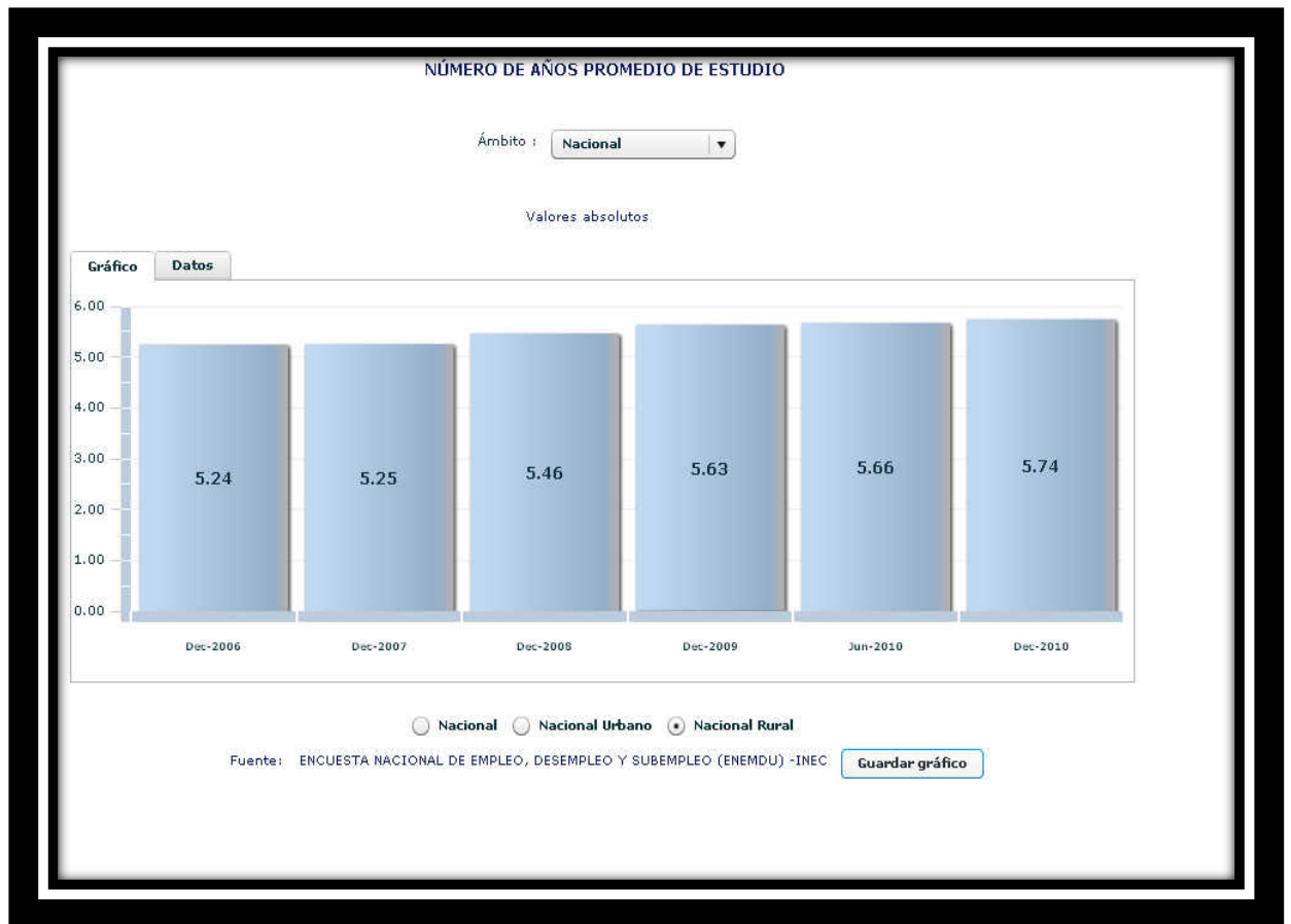
Gráfico 4. Número de años promedio de estudio a Nivel Nacional Rural. (I.N.E.C., 2011)

En resumen, la educación en nuestro país no ha logrado correr con buena suerte, y más bien ha tenido que sufrir etapas de profundas crisis que no se superan todavía. Sin embargo, hay en el lado positivo se puede divisar que poco a poco se intenta traspasar la vieja escuela en la que el profesor se convertía en el centro del conocimiento, además de la actual relación de comunidad educativa con la escuela, que produce interesantes procesos de cooperación. En este sentido, las primeras reflexiones que nacen de esta nueva relación es que los padres o jefes de hogar se involucran en los procesos de enseñanza-aprendizaje como actores vivos, y ya no sólo como meros castigadores o premiadores cuando las cosas van bien o mal con sus hijos.