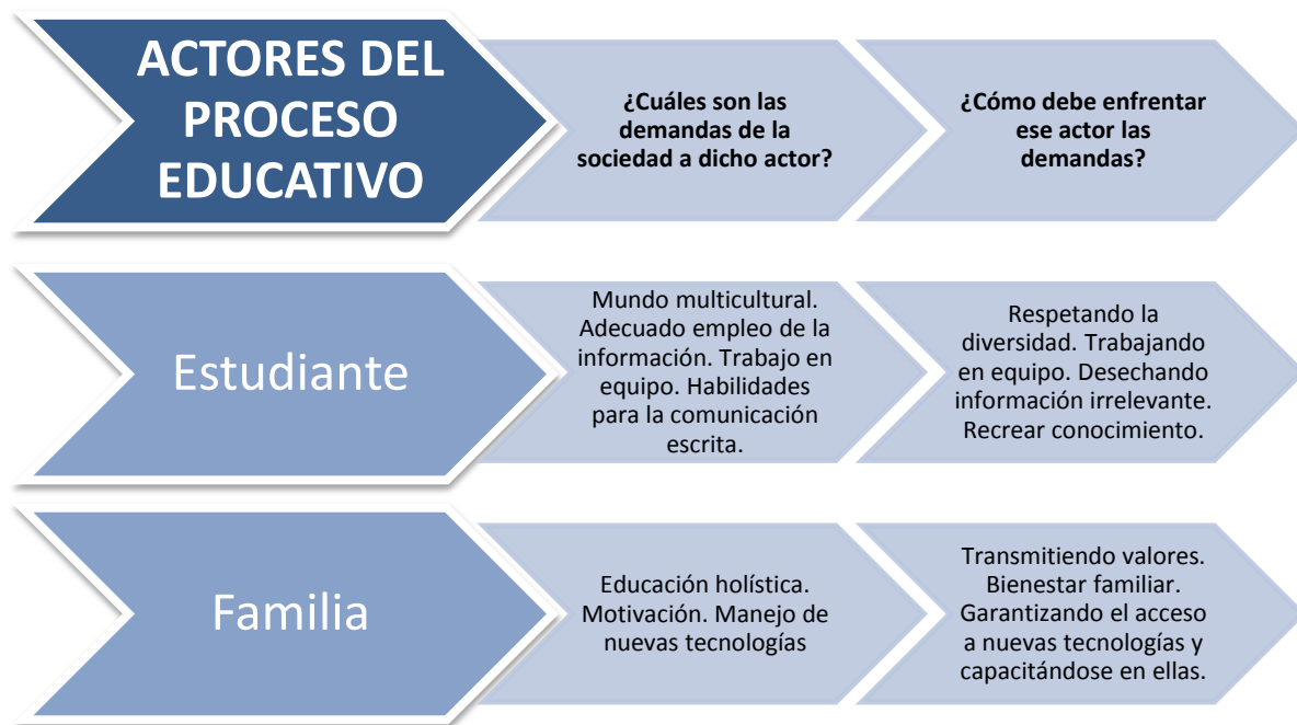
Gráfico 6. Demandas de la sociedad actual. (Morales López & Poveda Vásquez, 2010)

La sociedad le demanda al estudiante que se incorpore al mundo multicultural, que se forme para el empleo correcto de la información que aprende, que trabaje en equipo, entre otras demandas, pero no le exige que sea expedito en el uso de la tecnología, mientras que es a la familias a la que se le demanda, entre otras cosas, el manejo de las nuevas tecnologías. Lo que ocurre a veces es lo contrario, pues son los niños los que vienen de la escuela con el conocimiento de las nuevas tecnologías y las incorporan a la cotidianeidad familiar. La educación también es demandada al respecto, y se le señala como el principal asesor del uso de las herramientas tecnológicas, tal como lo señala Sunkel: