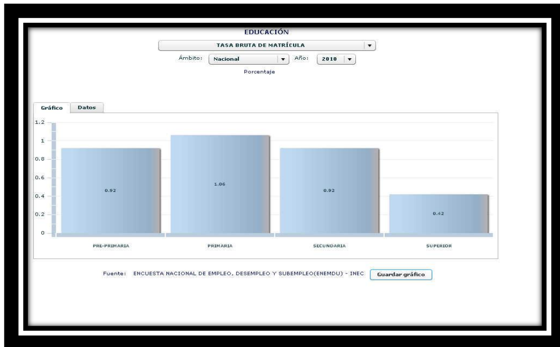
Gráfico 1. Tasa bruta de matrícula año 2010 (I.N.E.C., 2011)