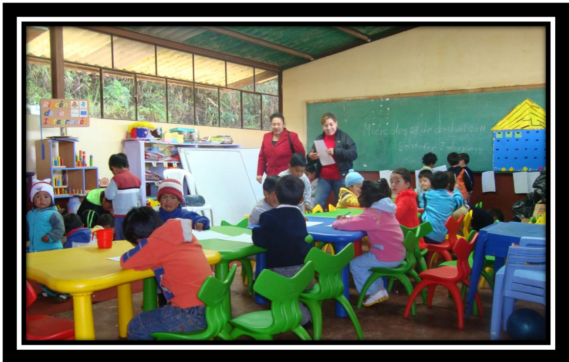
ESCUELA FISCAL “LUIS ALFONSO CALVACHI”