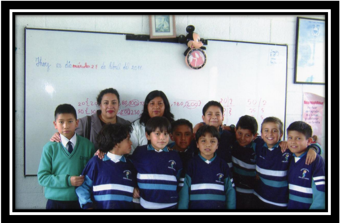
ESCUELA FISCOMISIONAL “MARÍA AUXILIADORA”