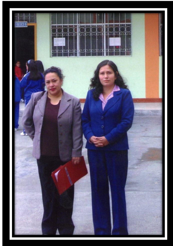
ESCUELA PARTICULAR “ÁNGEL DE LA GUARDA”