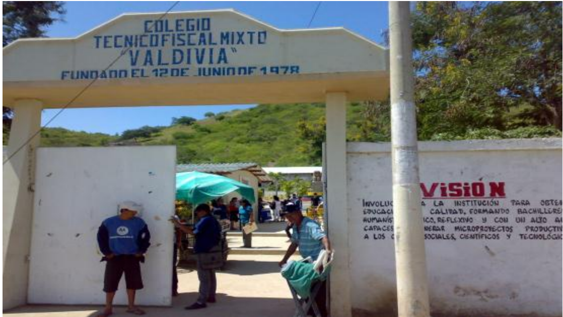
Puerta de entrada del colegio fiscal Valdivia, en donde se aprecia la misión y visión institucional.