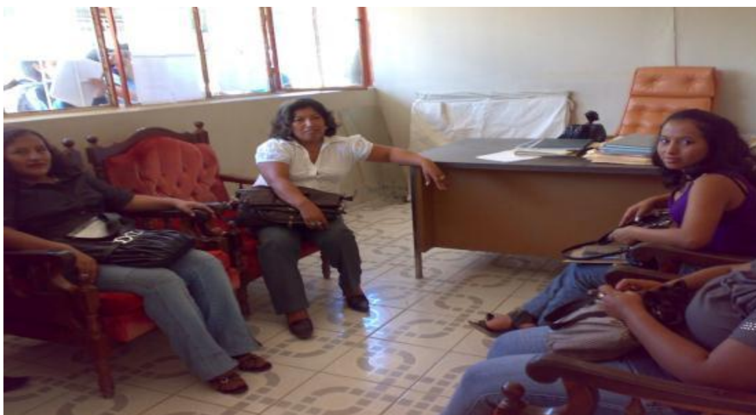
Grupo de docentes previa encuesta