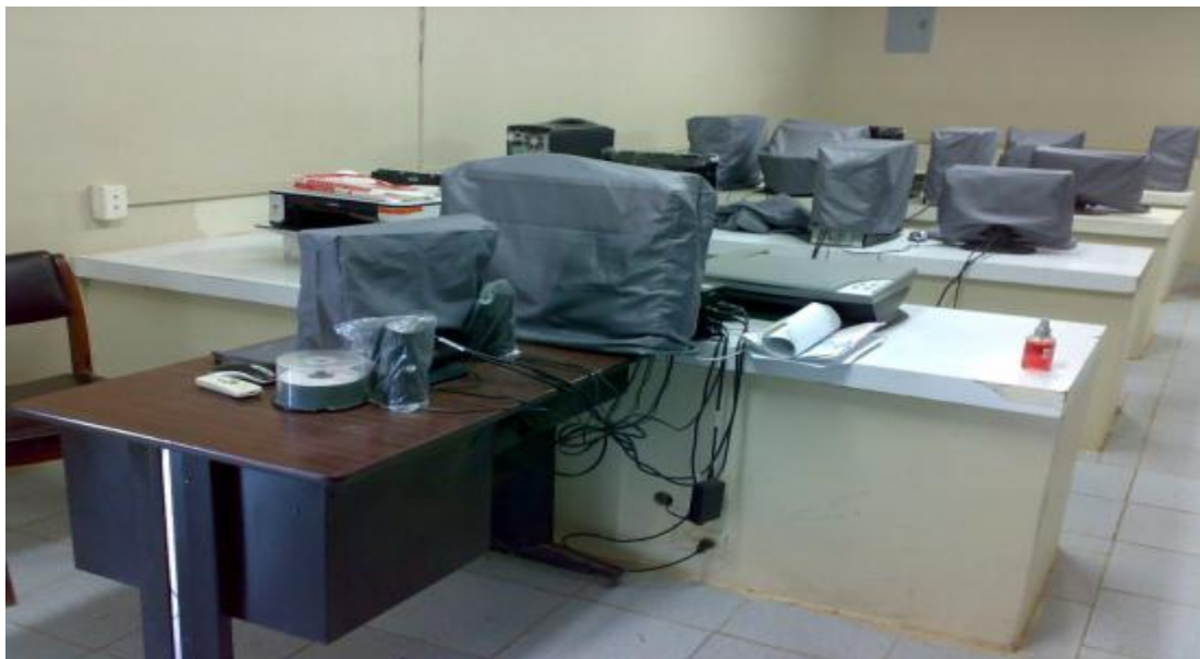
Parte de la sala de computación después de ser utilizado