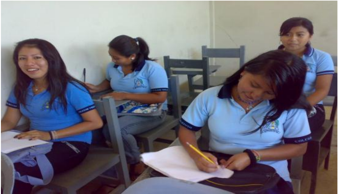
Estudiantes de tercer bachillerato durante encuestas