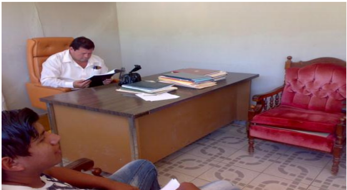
Vicerrector durante sesión de trabajo