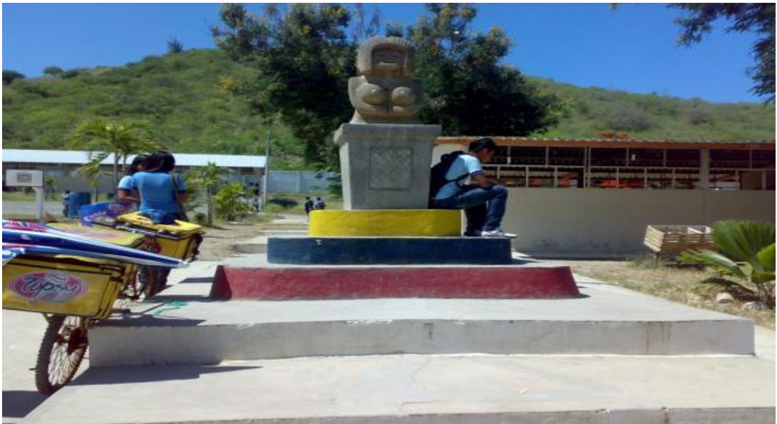
Monumento de la cultura Valdivia