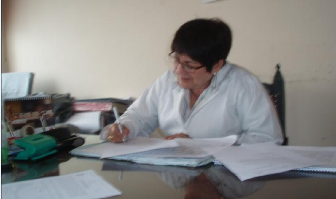
FOTO 2. DIRECTORA DE LA ESCUELA SANTA MARIANA DE JESUS DE LA CIUDAD DE LOJA