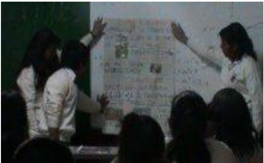
Observación a la clase