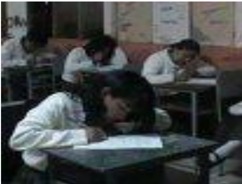
Momento de la observación a la clase .