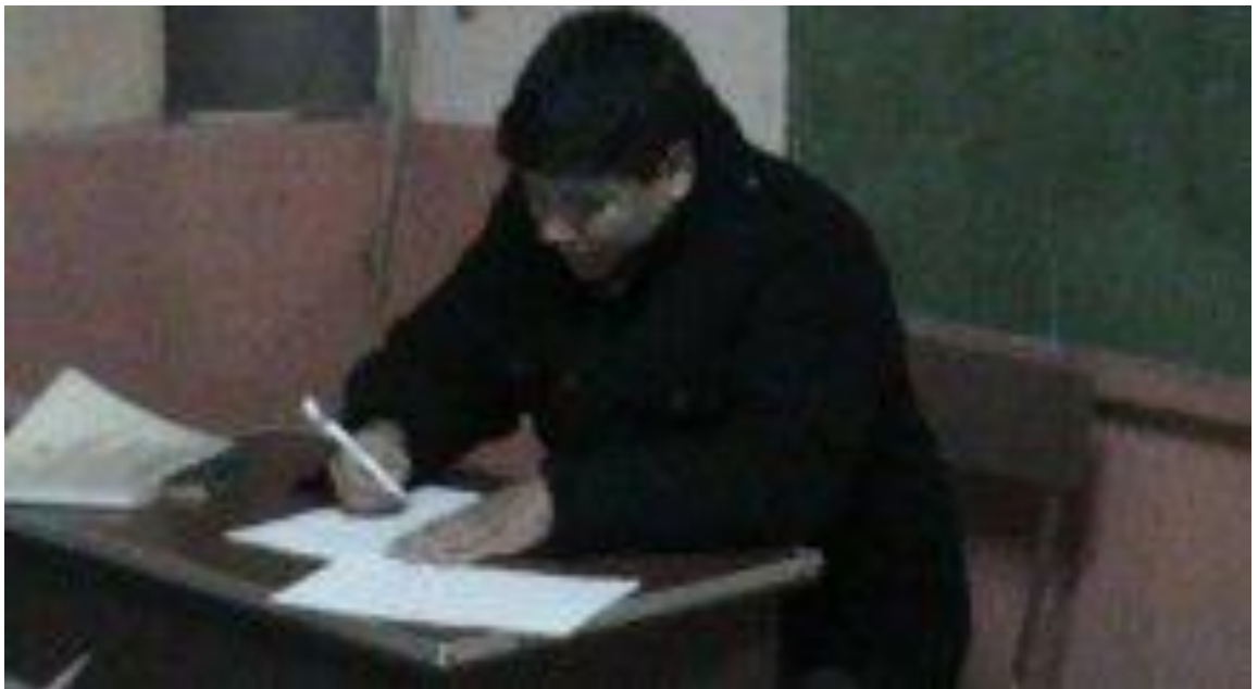
Momentos en que está siendo encuestado el Señor Rector de la institución