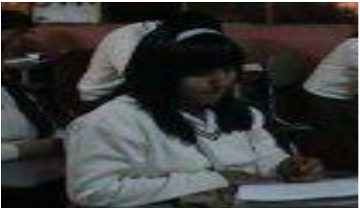
Momentos que el estudiante llena la ficha