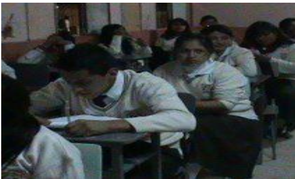
Momentos de la observación a clase en otro paralelo.