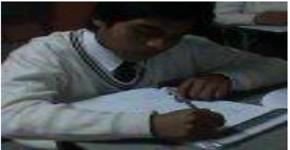
Observación a la clase.