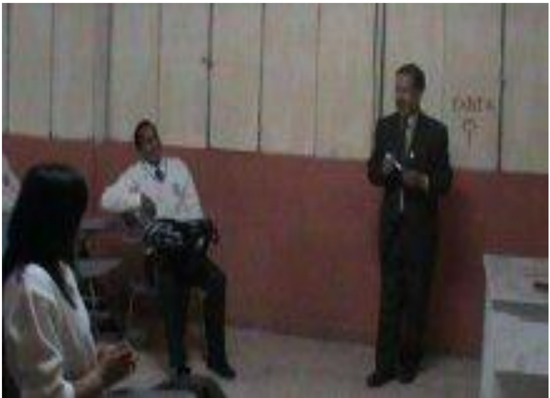
Grafico en la clase; el maestro dando su clase.