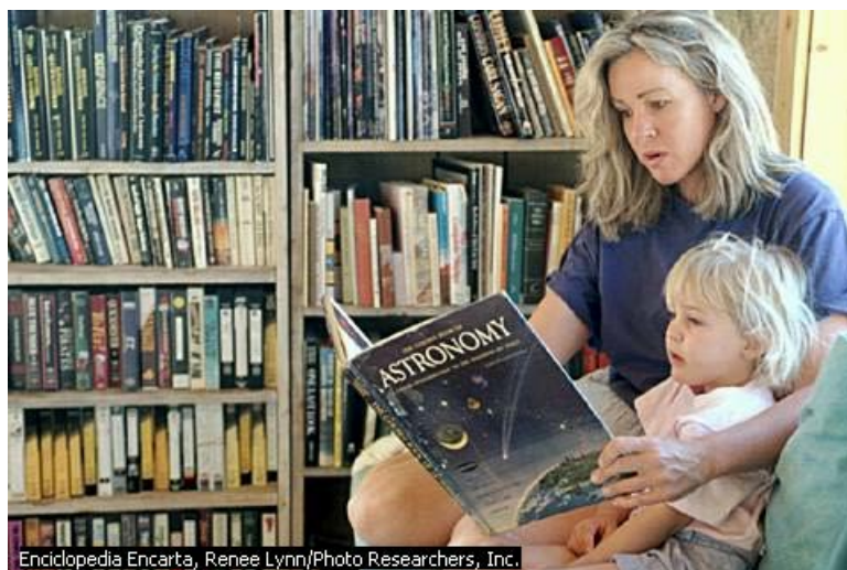
Enciclopedia Encarta, Renee Lynn/Photo Researchers, Inc.